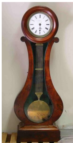
Horloge marquée « Laffitte de Marmande » Marmande, Musée Marzelles Inv. 939.1.22