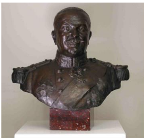
Raoul Lamourdedieu, Le Général Brun Marmande, Musée Marzelles Inv. 953.3.1

Le musée aborde également les « épopées coloniales » notamment avec les objets ramenés par Maurice Marzelles, frère d'Albert, lors de ses campagnes militaires.