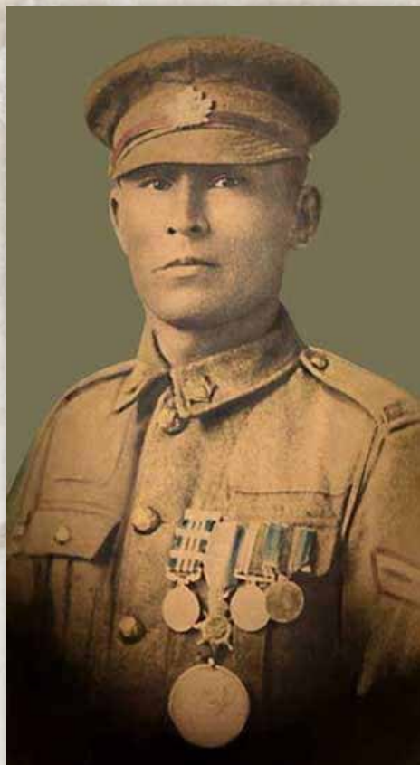
Francis Pegahmagabow