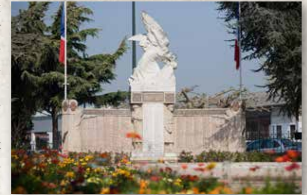
Le Monument aux morts de la ville de Marmande

Les premiers monuments aux morts apparaissent après la guerre de 1870 mais restent confidentiels. Jusqu'en 1914, le soldat n'a pas droit à une tombe, son nom n'est inscrit nulle part, comme oublié. A partir de 1919, la quasi-totalité des communes de France érigent un monument en hommage aux victimes de la guerre. Celui de Marmande est construit entre 1921 et 1922, il est l'œuvre du sculpteur, Raoul Lamourdedieu. Classé Monument historique en 2014, il affiche les noms des 342 Marmandais tués sur les champs de bataille pendant le premier conflit mondial.