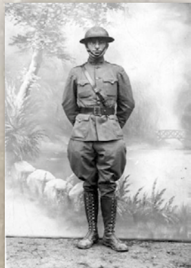
Harry Truman

Un million de soldats américains débarquent sur le continent européen entre 1917 et 1918. On les surnomme les « Sammys », en référence au fameux « Oncle Sam », surnom du new-yorkais, Samuel Wilson qui fit fortune en fournissant l'armée pendant la guerre anglo-américaine de 1812. Son sobriquet devient le symbole d'une Amérique paternelle. Une deuxième appellation caractérise les troupes US : celle de « Doughboys », qui elle, renvoie à la guerre de Sécession où les vareuses des combattants portaient des boutons en forme de doughnut (beignet).