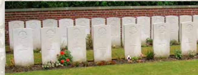
Des soldats du monde entier reposent dans les cimetières français de la Grande Guerre