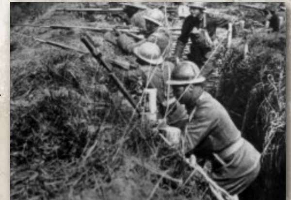
Les Harlem Hellfighters avec le casque Adrian

et noirs se battent côte à côte dans les tranchées... C'est donc avec le casque français Adrian vissé sur leurs têtes que s'illustrent les Harlem Hellfighters, première unité de 4 500 combattants noirs. Le plus célèbre d'entre eux, Henry Johnson, entre dans la légende en mai 1918 en se battant au couteau face à une vingtaine d'Allemands. Mais un autre nom marque également l'unité de Harlem, celui de James Reese Europe, premier jazzman à avoir joué au Carnegie Hall de New-York. Reese est nommé chef du groupe de musique des Hellfighters et parcourt des milliers de kilomètres sur les routes de France, trompette à la main, pour encourager les soldats qui montent au front. Pour la première fois, les Français entendent cette musique originale : le jazz.