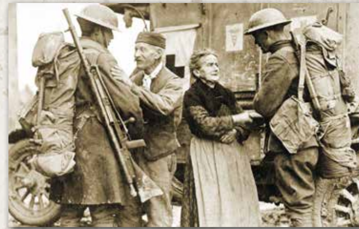
Couple de Français remerciant des soldats américains

Le 14 avril 1918, le bateau USS George-Washington accoste en rade de Brest et débarque les soldats du 129 e régiment d'artillerie. Parmi eux, un petit homme à lunettes de 34 ans qui prend le commandement d'un bataillon, missionné pour monter au front dans les Vosges. Son unité tire, en novembre 1918, les derniers coups de feu du conflit. Le petit homme à lunettes devient le 12 avril 1945, le 33 e président des Etats-Unis et se nomme Harry Truman. Il autorisera les bombardements atomiques d'Hiroshima et de Nagasaki en août 1945.