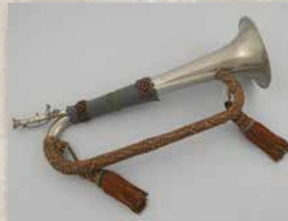
Le clairon de l'armistice est visible au musée des Invalides.