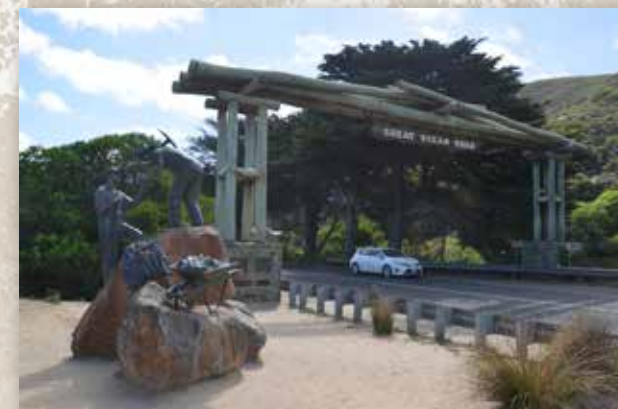
The Memorial arch : Great Ocean Road

Ces six hommes sont morts en juillet 1916 lors de la terrible bataille de Fromelles dans les Hauts-de-France et ont été enterrés dans des fosses communes. En 2016, grâce aux recherches lancées auprès des descendants des soldats et à des analyses ADN, les corps de ces six soldats ont été identifiés et des tombes gravées à leurs