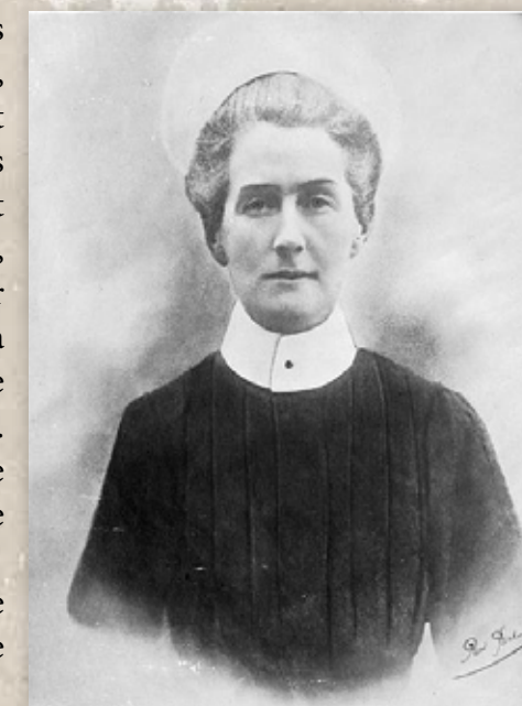
Edith Cavell

C'est à cette infirmière qu'Edith Gassion, enfant de 1915 et mondialement connue sous le pseudonyme d'Edith Piaf, doit son prénom.