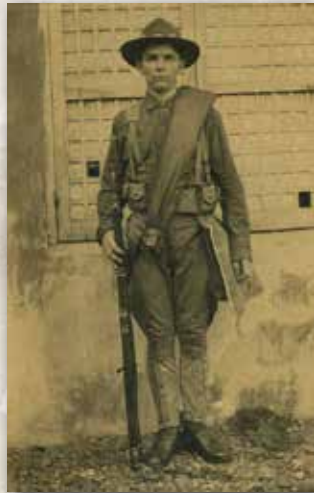
Un Sammy

Un an avant l'entrée en guerre des Etats-Unis, en avril 1916, de jeunes aviateurs américains créent l'escadrille La Fayette, avec l'assentiment du commandement français. Composée de 38 pilotes et de cinq officiers, l'escadrille entre dans la légende des combats aériens du premier conflit mondial. Leurs exploits et leur engagement volontaire contribuent également à