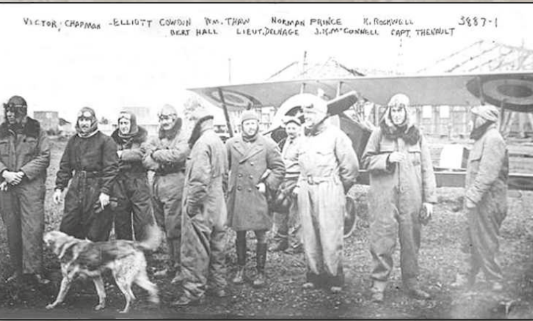
L'escadrille La Fayette

l'évolution de l'opinion américaine sur la réalité de la guerre en France. Le groupe La Fayette Flying Corps a été cité dans l'Ordre de l'armée de l'air, de la Croix de guerre et de la Médaille militaire.