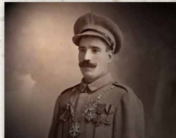
Anibal Milhais

Anibal Milhais devient le « soldat millions », que ses exploits font le tour du monde et que son village devient Valongo de Milhais. Anibal est le seul non gradé à recevoir le collier de l'Ordre de Torre e Espada, la plus haute distinction militaire du Portugal.