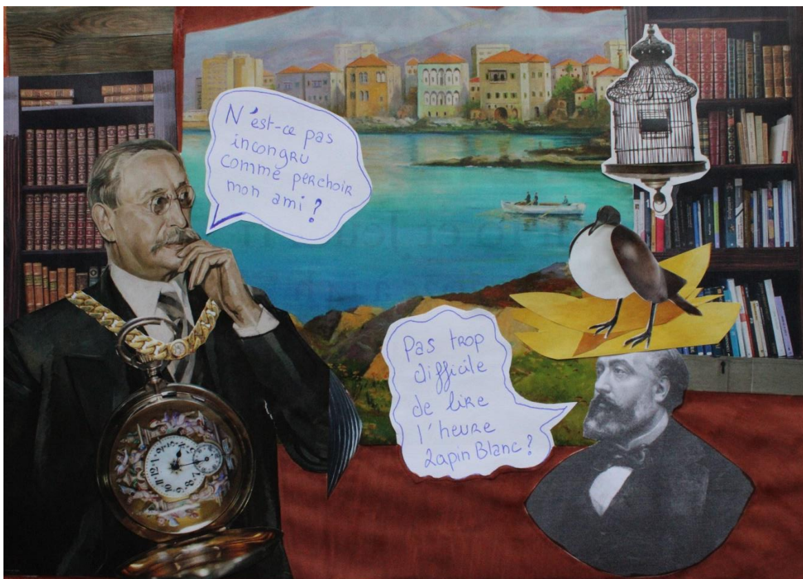
Figure 3 : Exemple Collage surréaliste autour du portrait de Léon Gambetta (à droite) à l'aide d'éléments découpés dans le magazine Drouot

Ils écriront ensuite quelques lignes sur ce personnage ou sur l'univers de fantaisie qu'ils ont créé.