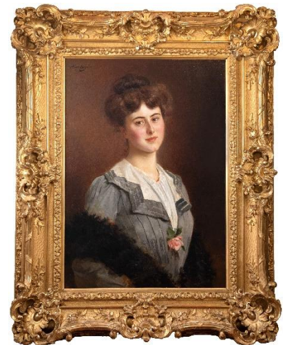
Figure 1 : Abel Boyé, Portrait de Marcelle Nadeau , XIXe-XXe siècle, Musée Marzelles

Le genre du portrait, longtemps limité à la représentation des puissants, est un témoin des sociétés, illustrant notamment l'évolution des classes sociales.