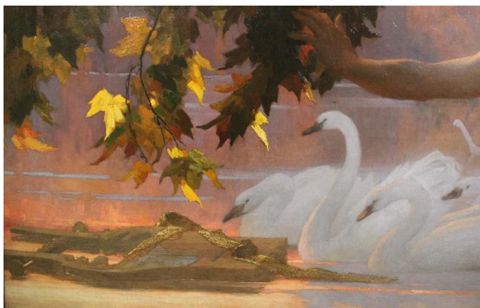
Figure 5 : Détail de la lyre dans La Lyre immortelle peinte par Abel Boyé

Comment sera construit ce « Devine tête » alternatif et comment jouerons-nous concrètement ?