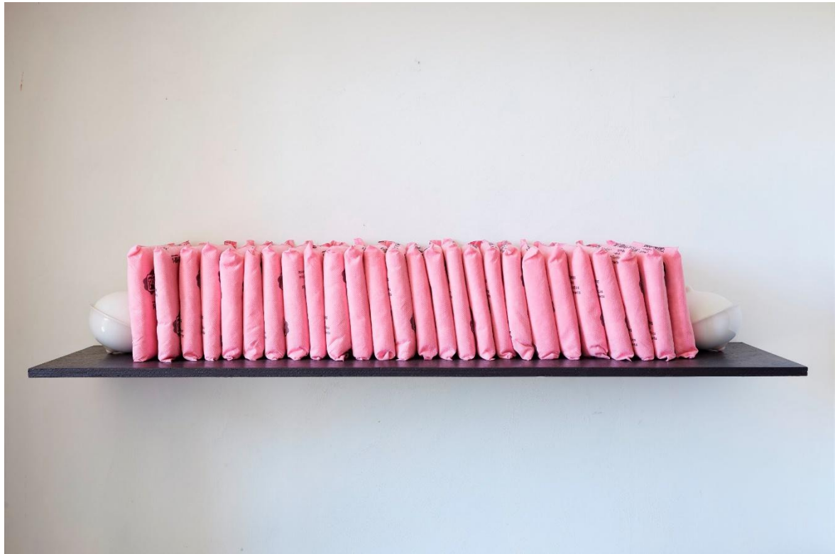
Ghislaine Portalis Bibliothèque rose 2003

Bibliothèque rose (2003), est une œuvre formée de vingt-six coussins absorbants pour produits chimiques commandés sur un catalogue de fournitures industrielles.