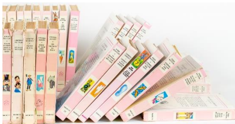
Figure 1 : Exemples de livres de la collection Hachette Bibliothèque rose

Le titre de l'œuvre fait explicitement référence à la collection de livres Hachette jeunesse du même nom identifiable par leur couverture rose (voir Figure 1). La couleur rose de cette collection Hachette n'est pas genrée autrement dit pour filles comme on pourrait le penser. Cette couleur renvoie à une catégorie d'âge 6-12 ans. Le choix du matériau (coussins industriels) utilisé par Ghislaine Portalis, fait, lui référence à un processus hormonal féminin : les menstruations. Si le cycle menstruel des femmes reste toujours un tabou social dans la vie quotidienne où l'achat de protection périodique est bien souvent caché comme quelque chose de honteux, cette œuvre expose fièrement cet achat. Composée de plusieurs dizaines de coussins absorbants industriels roses rappelant les serviettes hygiéniques absorbant les menstruations des femmes, ceux-ci sont accumulés et disposés à la verticale tels des ouvrages dans une bibliothèque.