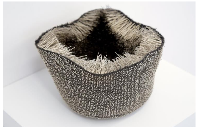
Figure 5 : Coiffe , 2010

Vues de l'exposition Camera dell'eco , Pavillon Vendôme, Aix-en-Provence, 2023.