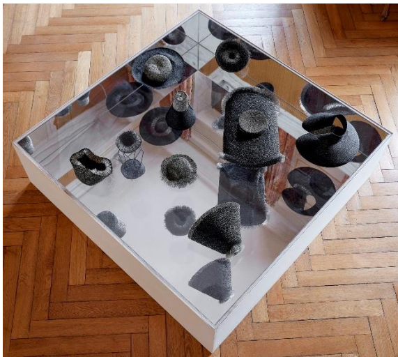
Figure 6 : Coiffes , 2010-2023, chapeaux de paille noire, aiguilles de couture, dimensions diverses.

Ces parures visant à embellir les femmes nous renvoient également aux traditions et aux codes de beauté féminins liés aux cheveux et aux épingles. L'acte de création peut par exemple nous rappeler la tradition durant la Sainte Catherine (protectrice entre autres des couturières). Les jeunes filles en âge de se marier devaient planter une aiguille dans un chapeau.