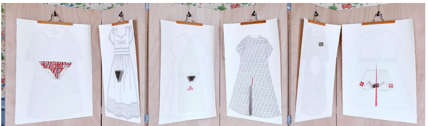
Figure 2 : Sœur Anne, ne vois-tu rien venir , 2023.

Paravent, pinces de pantalon, 6 dessins sur papier aquarelle Arches, feutre argent, rouge et noir, épingles de couture, 77 x 57 cm (chacun). Vues de l'exposition Camere dell'eco , Pavillon Vendôme, Aix-en-Provence, 2023.