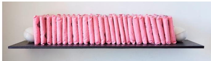
Ghislaine Portalis, Bibliothèque rose , 2018, 26 coussins industriels absorbants roses, étagère bois, peinture acrylique noire, 130 x 22 cm