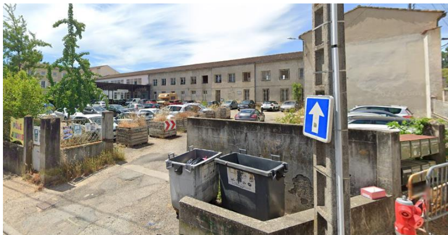
L'ilot des capucins vu de la rue de l'Observance

L'objectif de cette rencontre était de présenter le futur aménagement de la bâtisse de l'ilot des capucins (ex-collège), aujourd'hui en friche.