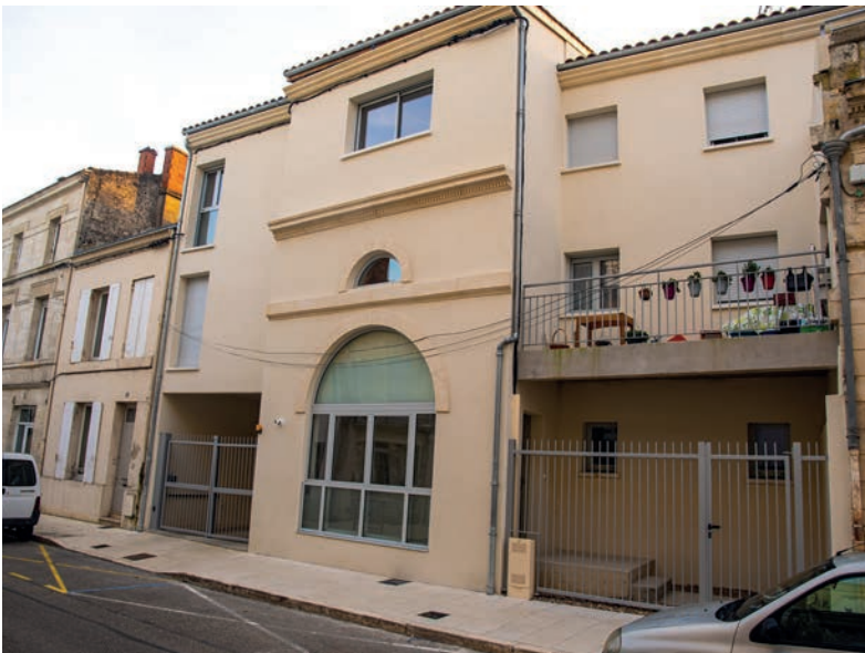
Nouvelle résidence rue de la Libération ▲