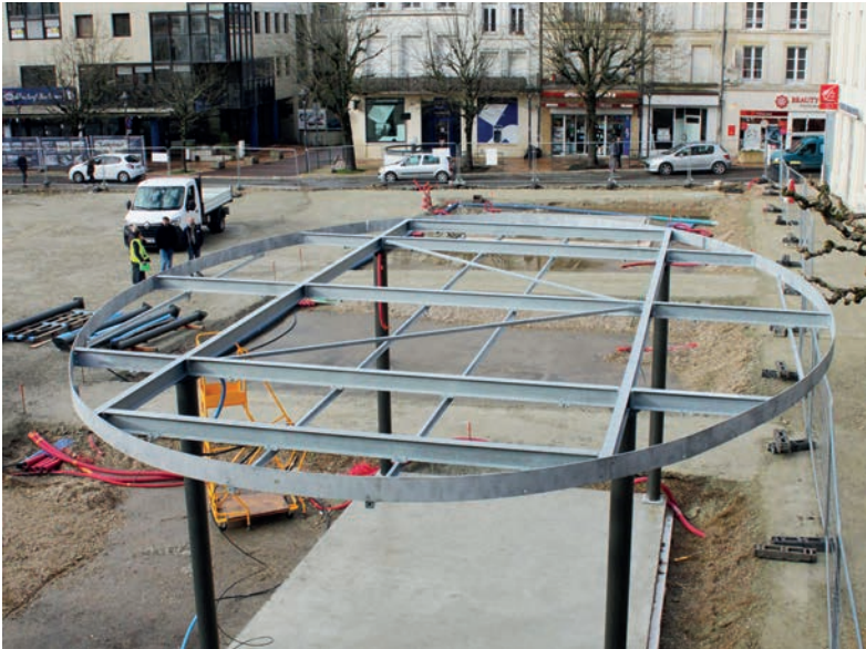
▲ Montage des pergolas Place Clemenceau