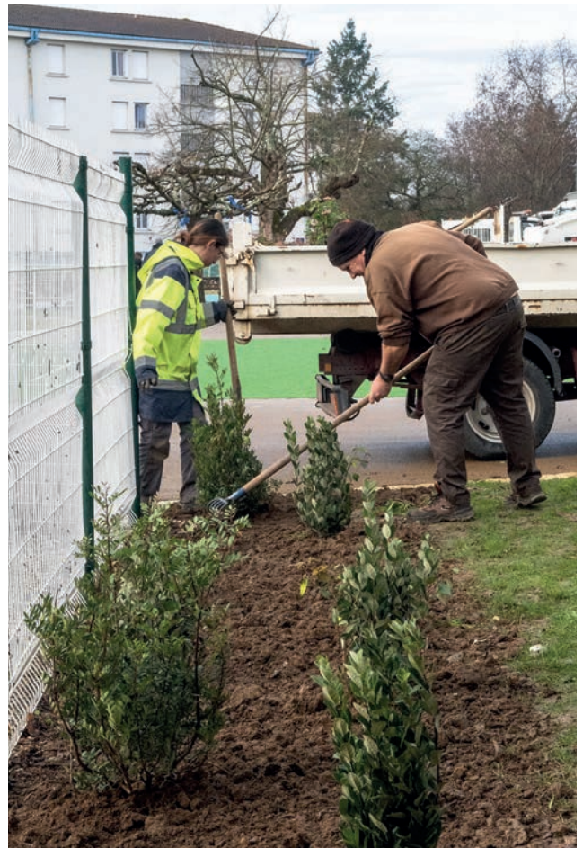
Plantation de végétaux aux abords de l'école Labrunie. ▲

Les espaces verts sont aussi des espaces de socialisation, ils favorisent la promenade, la discussion avec les autres passants... Comme tous les habitants ne disposent pas d'un jardin, les jardins familiaux –terrains attribués à des personnes à revenus modestes souhaitant pratiquer le jardinage pour leur alimentation à l'exclusion de tout usage commercial – sont une solution. Pour ceux de Carpète, une mise à jour est en cours concernant le règlement intérieur, l'usage de l'eau, l'entretien... et pour recenser les parcelles libres afin de répondre à la demande des personnes en liste d'attente. En 2023, la ville va proposer de nouveaux jardins familiaux dans le secteur du Château d'Eau avec des parcelles de 100 à 200m 2 . Avant l'attribution, un travail préparatoire de sensibilisation sera effectué avec les futurs jardiniers. C'est la première étape du Pacte Alimentaire pour répondre à "Comment se nourrit-on aujourd'hui?". Et dans le parc central de La Gravette sont envisagés des jardins partagés, créés ou utilisés collectivement, ouverts au public avec possibilités d'animations éducatives et écologique.