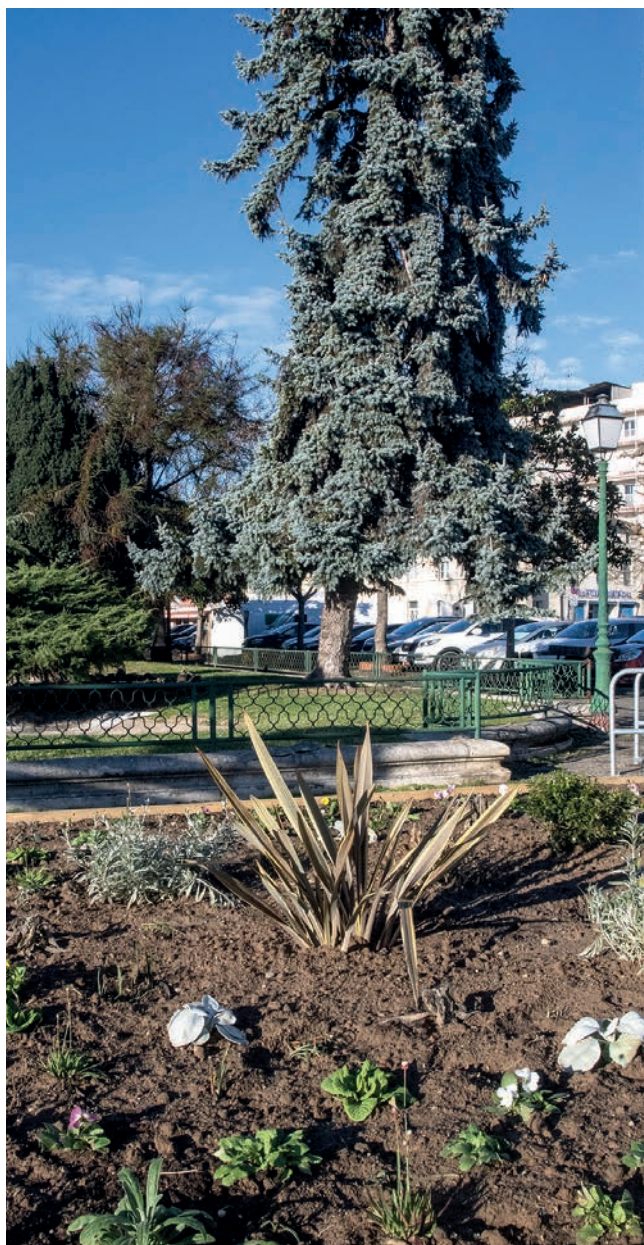
▲ Nouvel espace végétalisé à proximité de la place de la Couronne.

Aujourd'hui, face aux enjeux d'adaptation au changement climatique et au besoin de la population de respirer un air plus pur, la végétalisation des espaces publics constitue une réponse. En quoi le végétal est-il un élément essentiel au bien-être en ville ?