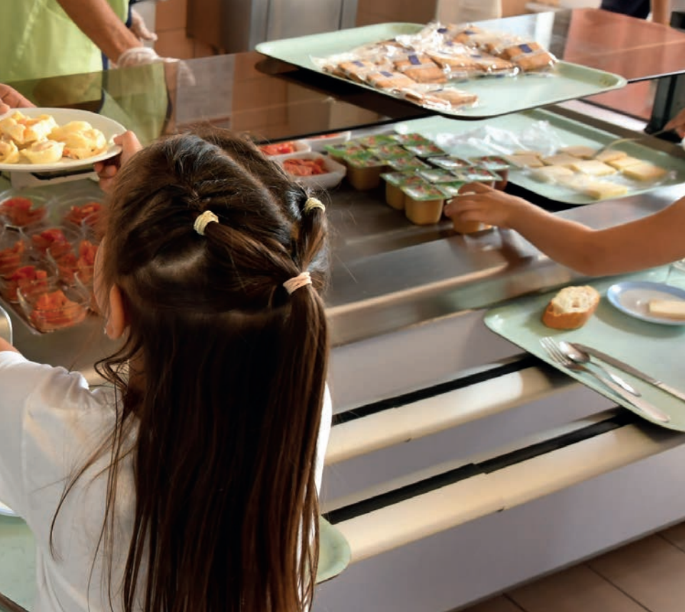
Bien manger à l'école, une priorité municipale ▲