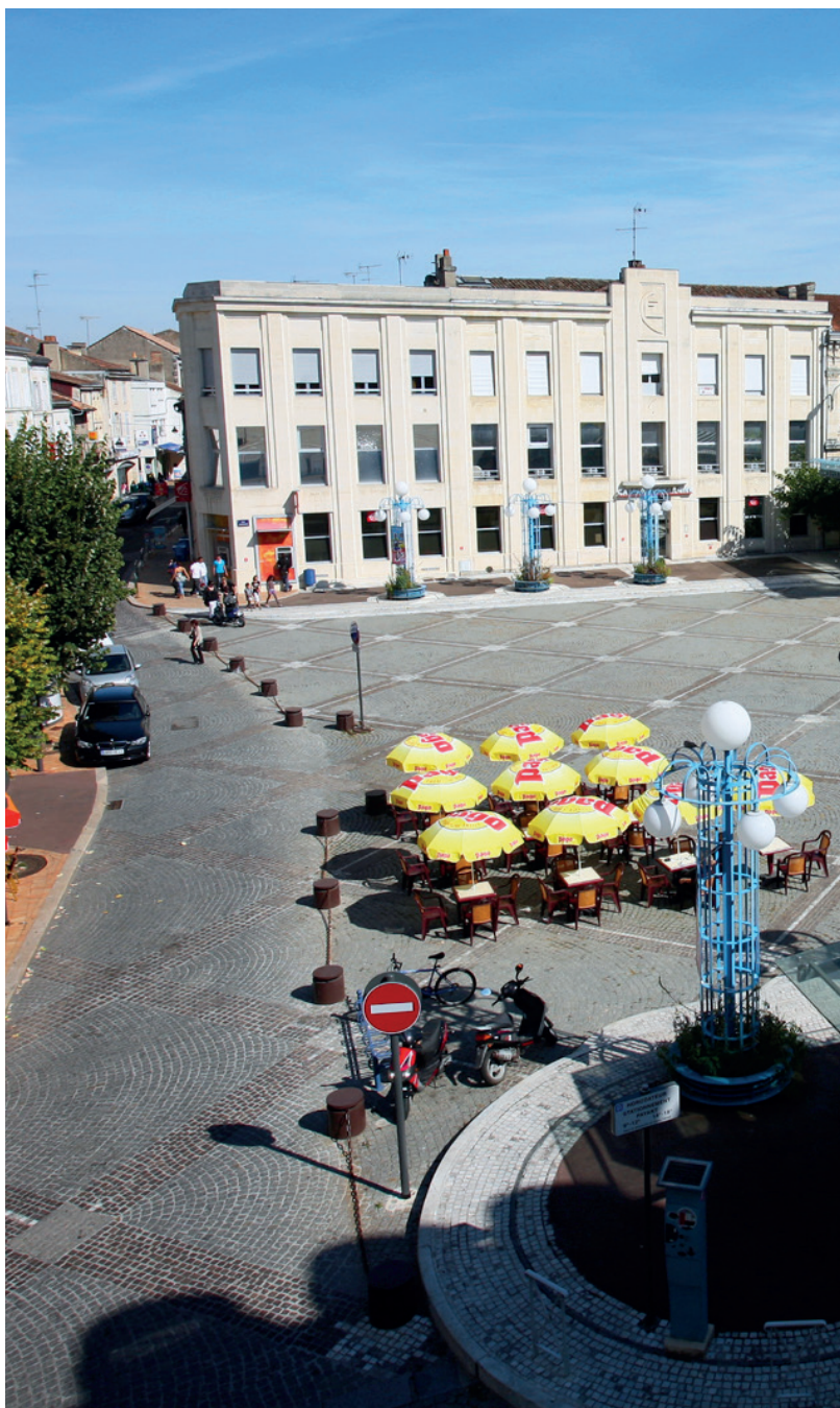
▲ La place Clemenceau, située entre les rues Charles De Gaulle, Léopold Faye, Abel Boyé et la rue du Palais.