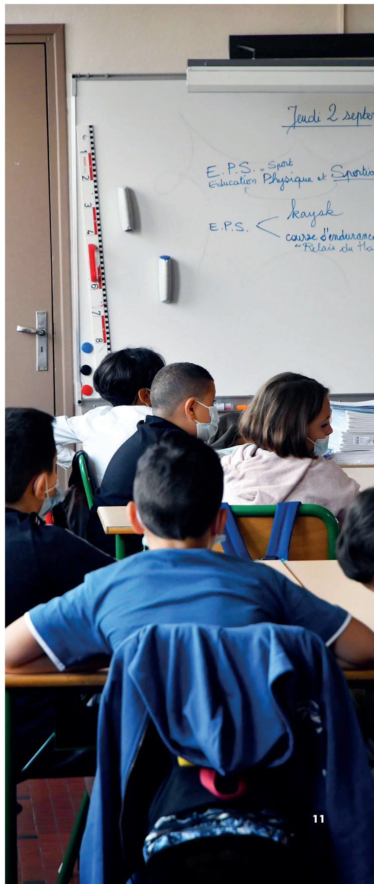
► Une nouvelle année scolaire débute pour tous les écoliers de Marmande en ce jeudi 2 septembre.