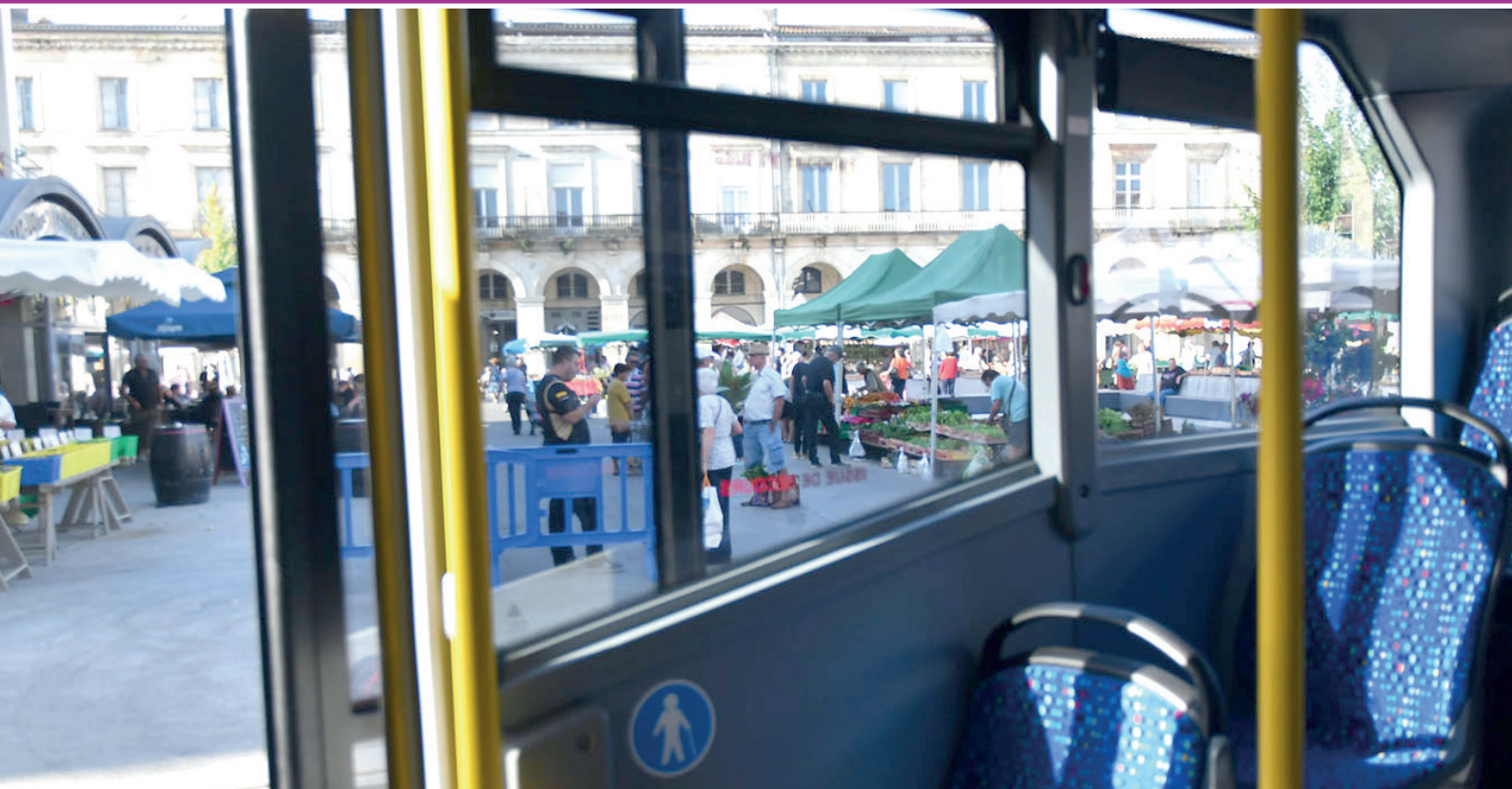
Une nouvelle façon de se rendre place du Marché.