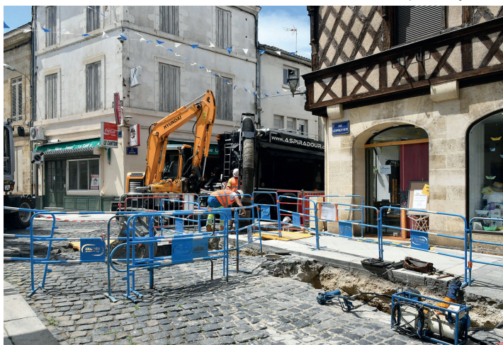
Travaux rue Léopold Faye et simulation du rendu final.

Les commerces sont ouverts pendant les travaux et sont accessibles à pied.