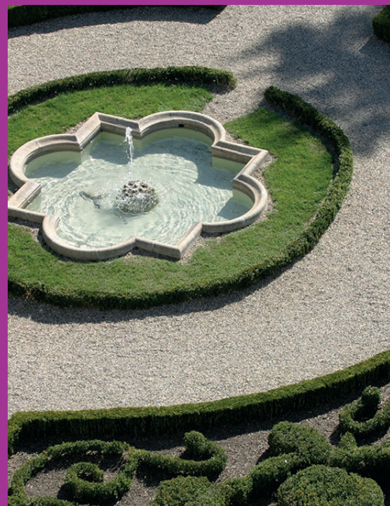
Le Jardin remarquable du cloître de Notre-Dame