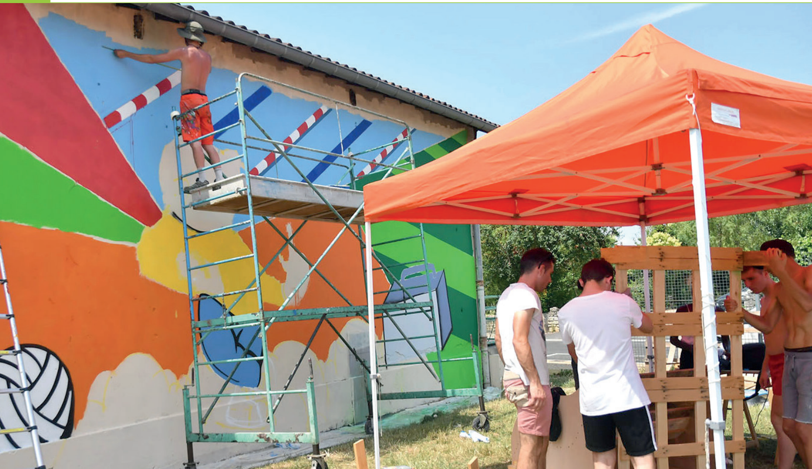
Ateliers graffs et fabrication d'éco-mobilier.