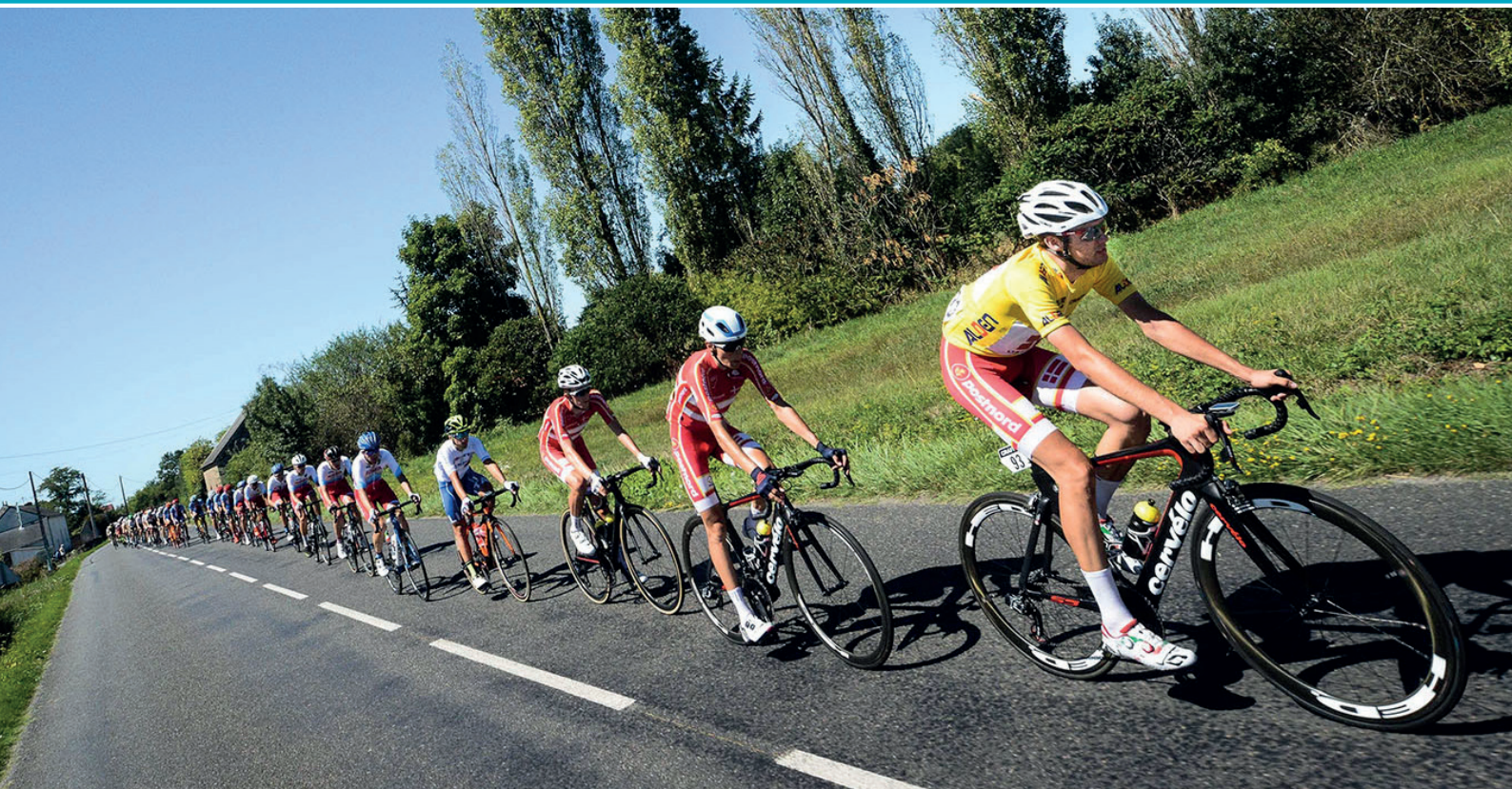
Les cyclistes du Tour de l'Avenir 2019 découvriront les routes du Marmandais.