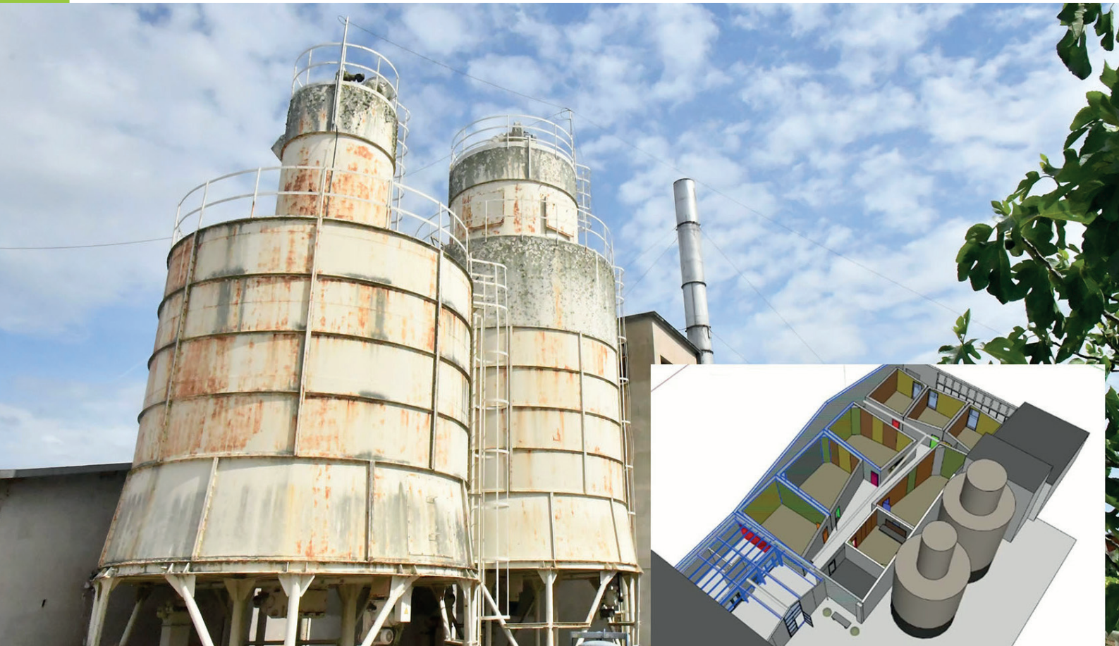
Les silos, marqueurs de l'usine Césa conservés dans le projet final..