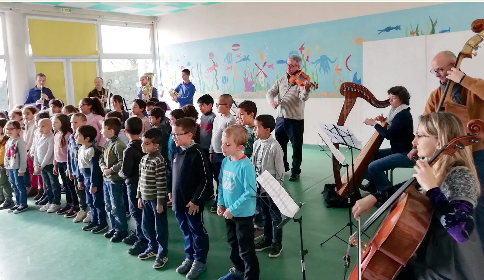
Tépakap ou l'accès à l'éducation musicale aux enfants marmandais.