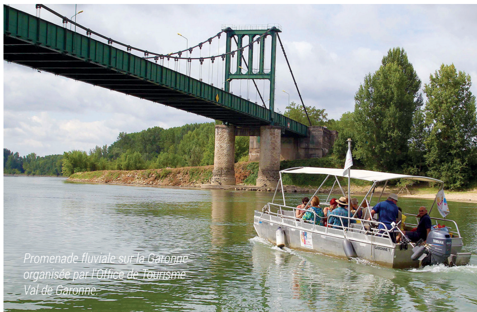
Promenade fluviale sur la Garonne organisée par l'Office de Tourisme Val de Garonne.

Aujourd'hui, on ne va pas n'importe où, on passe du temps en amont à rechercher une destination, le bon hébergement au meilleur coût, de nouvelles sensations... Marmande a des atouts à faire valoir notamment dans le tourisme de proximité. Des axes de réflexion pour un écotourisme sont déjà engagés, quelques exemples.