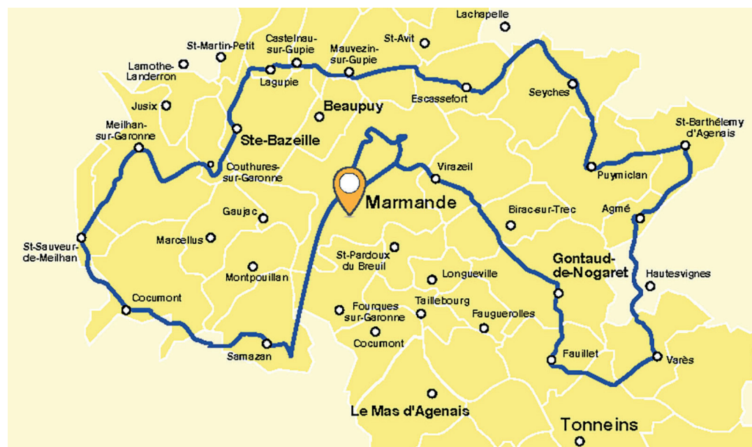
Le parcours de l'étape en Val de Garonne.

L'impact d'un tel événement est d'abord médiatique avec des retrans-