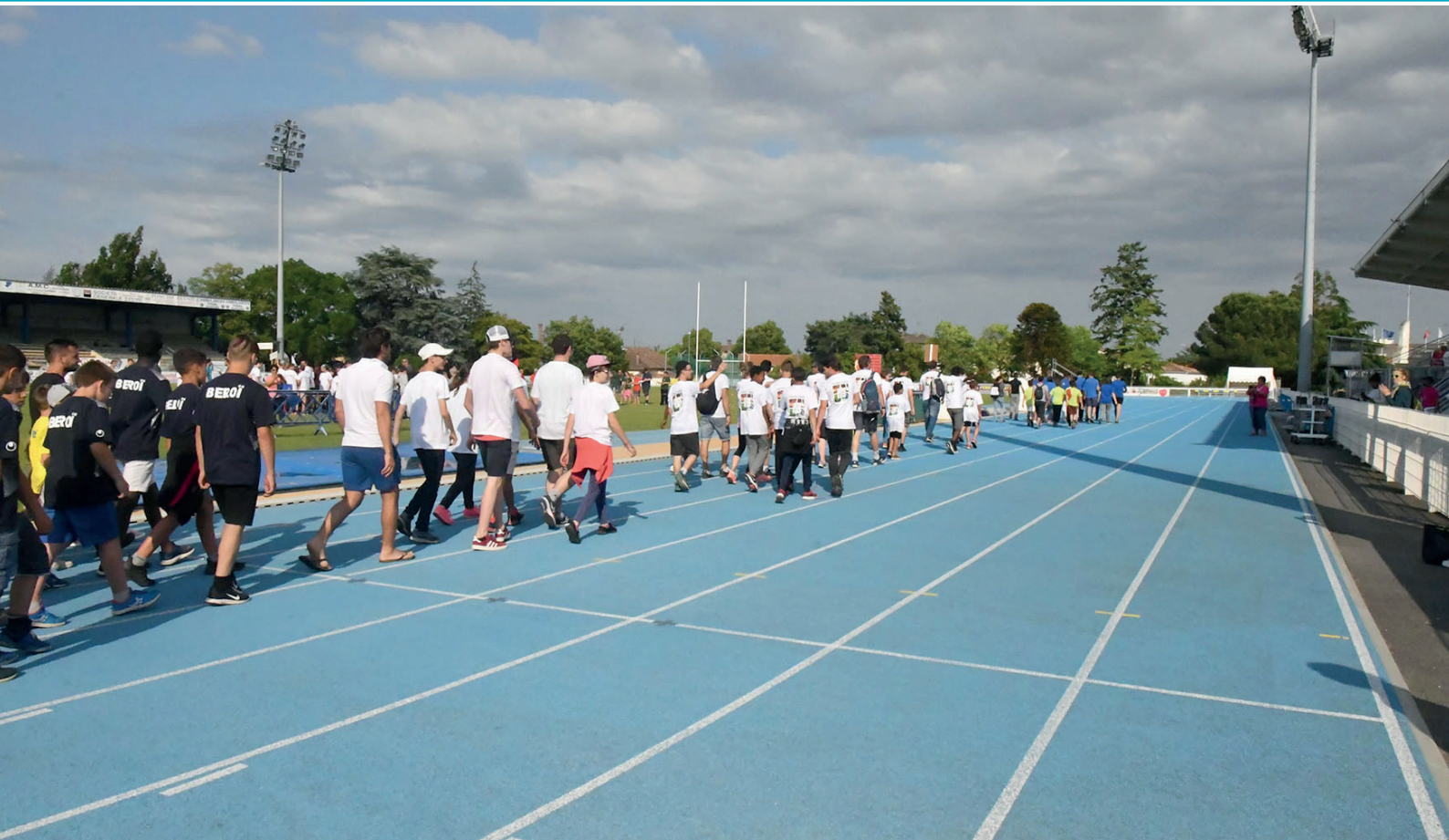
Défilé des participants aux Championnats de France d'Athlétisme de sport adapté.