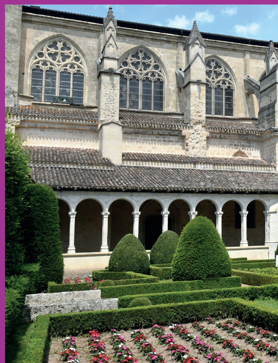
Jardin du Cloître de l'église Notre-Dame.

avec ses petites sources, sa petite île et le lavoir des cinq cannelles. En centre-ville, le jardin des Droits de l'Homme est aménagé avec des jeux pour enfants. La ville a été couronnée en 2017 « Villes et villages fleuris Label de qualité de vie » décerné par le Comité Régional du Tourisme.