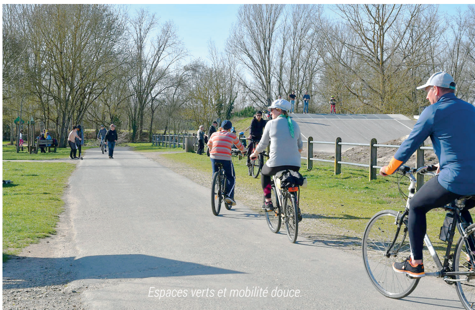
Espaces verts et mobilité douce.

Mettre une ville en mouvement suppose la mise en place d'un projet urbain coordonné et répondant aux évolutions et mutations actuelles avec un double enjeu vital, l'attractivité de la ville elle-même et la qualité de vie des habitants. Bref, un question d'équilibre