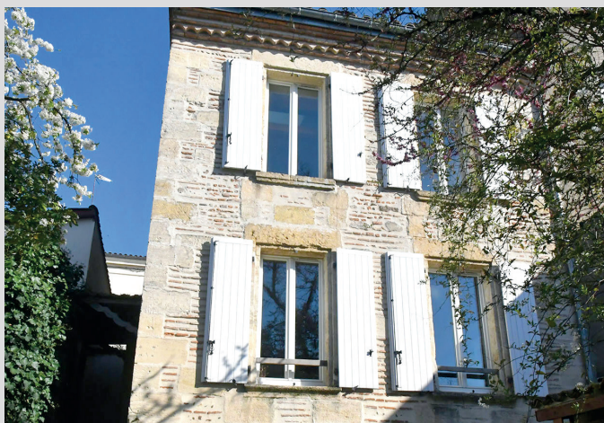
Une façade rénovée par l'OPAH-RU..