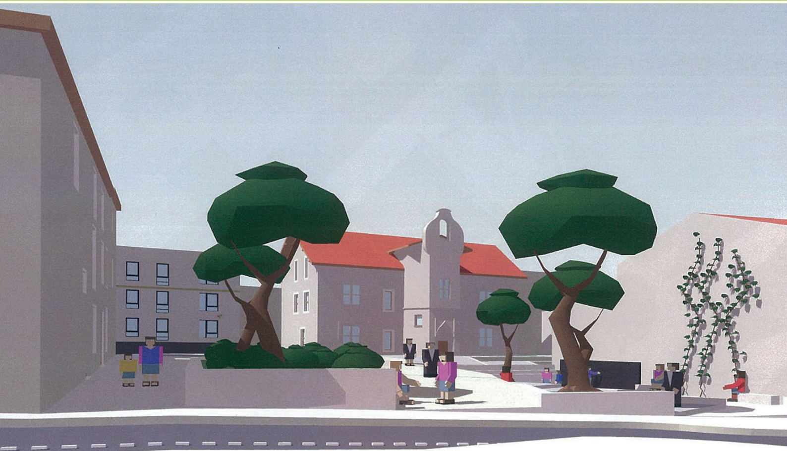
Projection de la future place Îlot des Religieuses