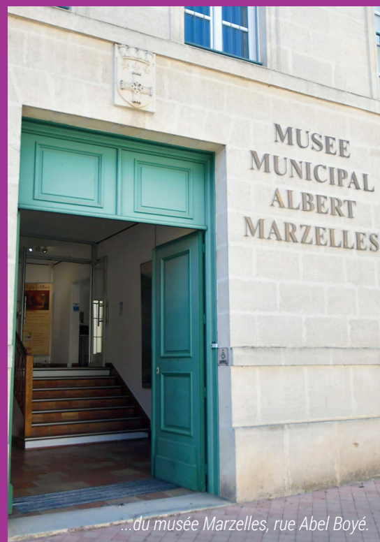
...du musée Marzelles, rue Abel Boyé.

Franchissez la porte, l'entrée de ce lieu culturel et lieu de vie, est gratuite !