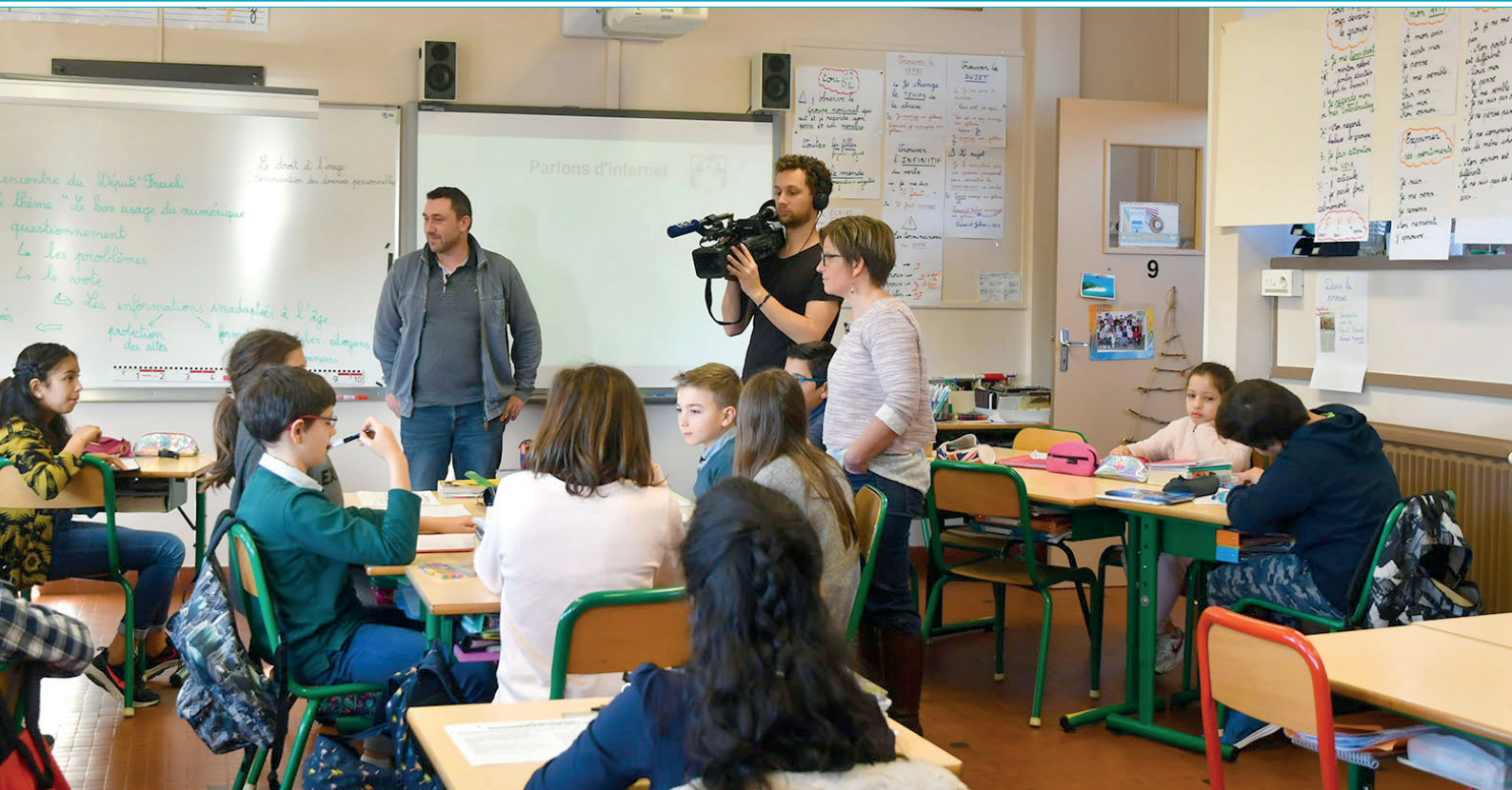
Première visite de la Chaîne Parlementaire (LCP), dans la classe de CM2 de l'école Herriot.