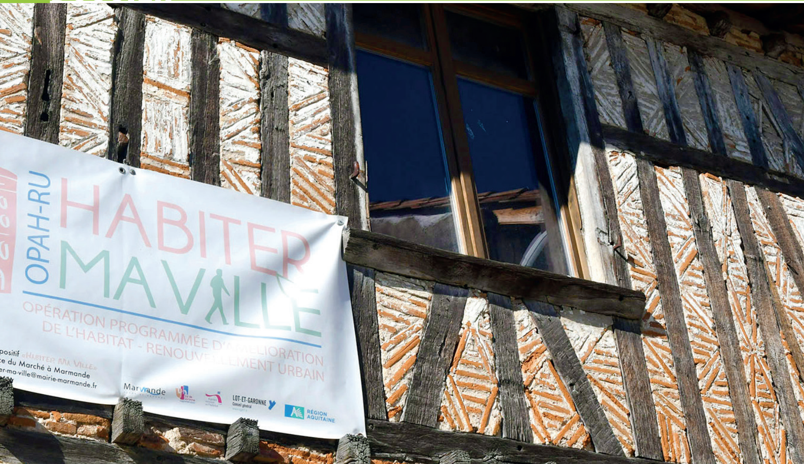
Un exemple de rénovation de façade dans le centre-ville.