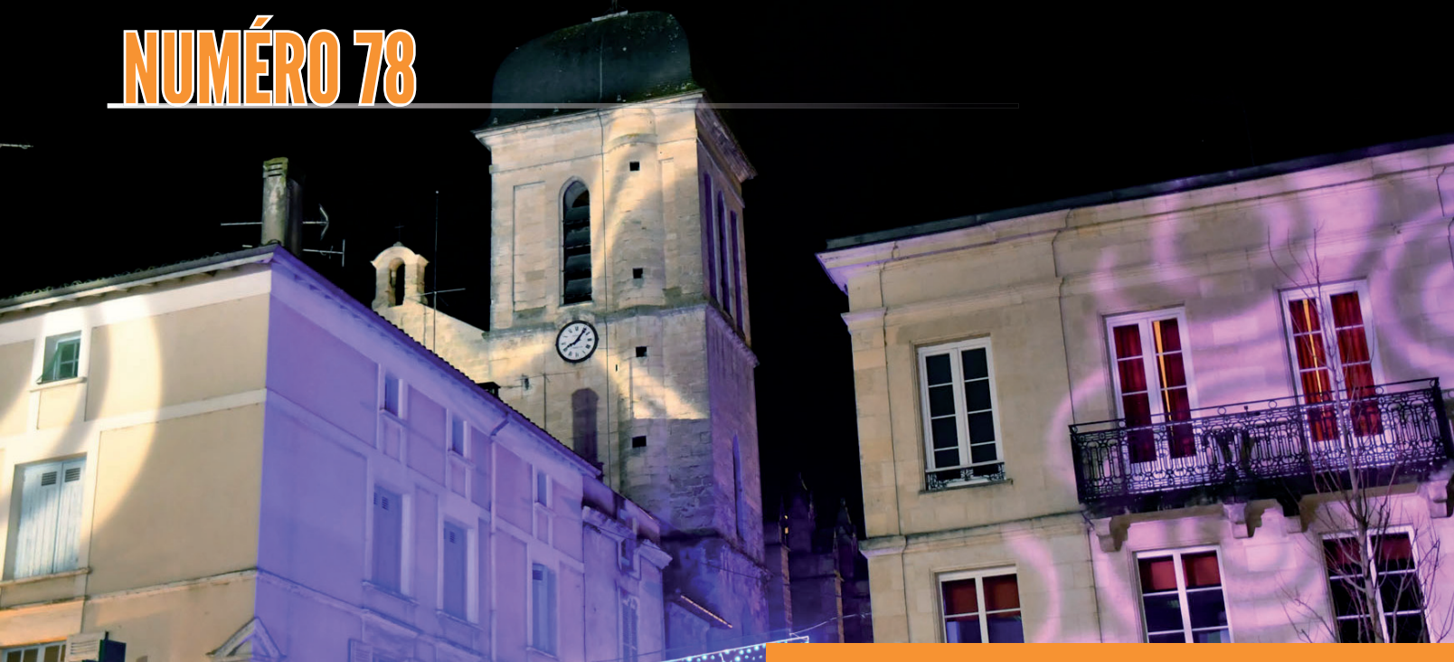
Le quartier du Marché baigné par les lumières de Noël.