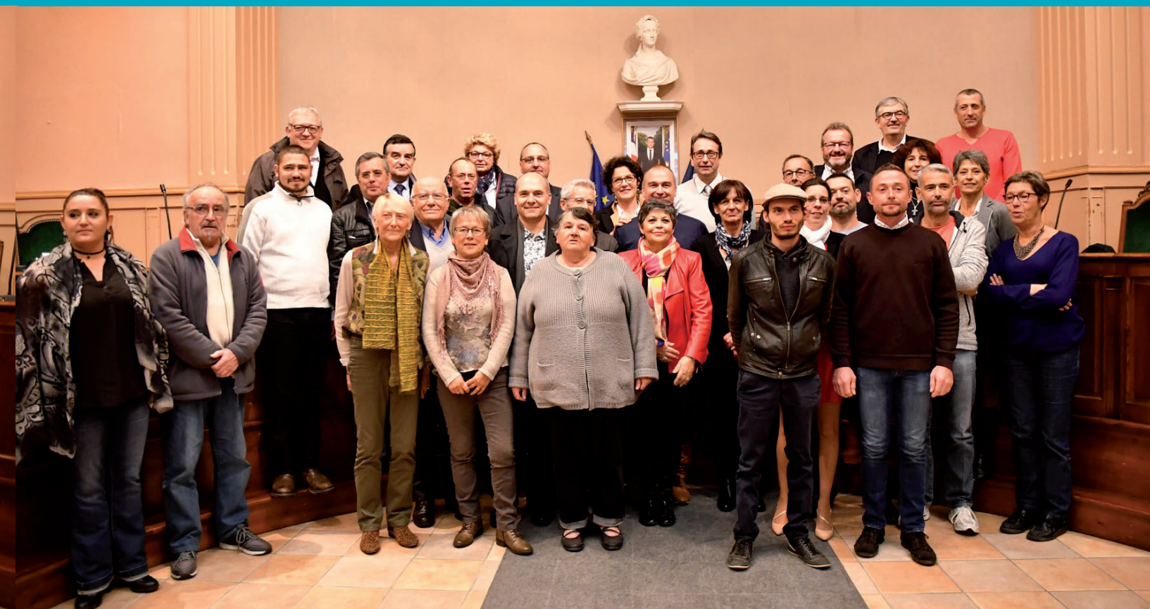
Les nouveaux représentants élus de vos conseils de quartier.