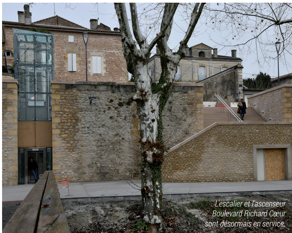
L'escalier et l'ascenseur Boulevard Richard Cœur sont désormais en service.

La rue de la République est aujourd'hui en sens unique entrant. Baisser la vitesse des flux de circulation en centre-ville et y remettre de la diversité est un choix. La rue rénovée en zone de rencontre, donne un espace aux piétons, cyclistes et véhicules.