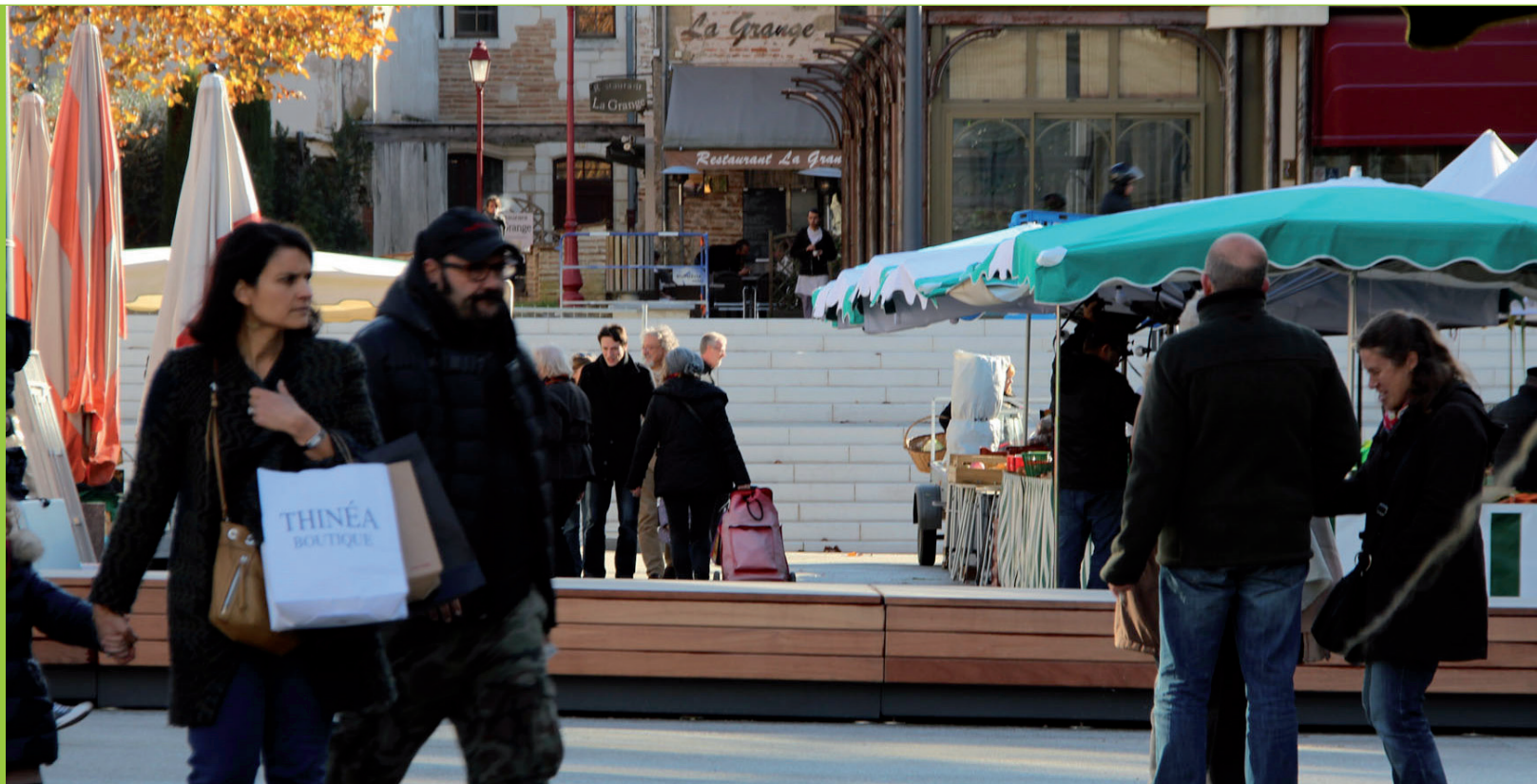
Les travaux terminés, les Marmandais se réapproprient la place du marché.