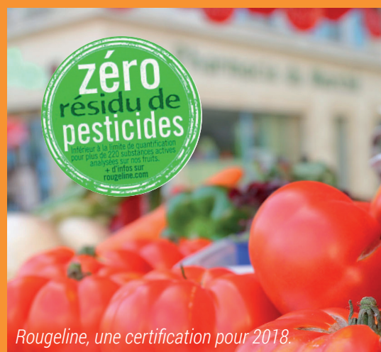
Rougeline, une certification pour 2018.

Les chiffres de l'emploi sont plutôt positifs sur la zone de Marmande. Nos entreprises locales elles, misent sur l'innovation et/ou le développement durable pour être leaders sur leurs marchés.