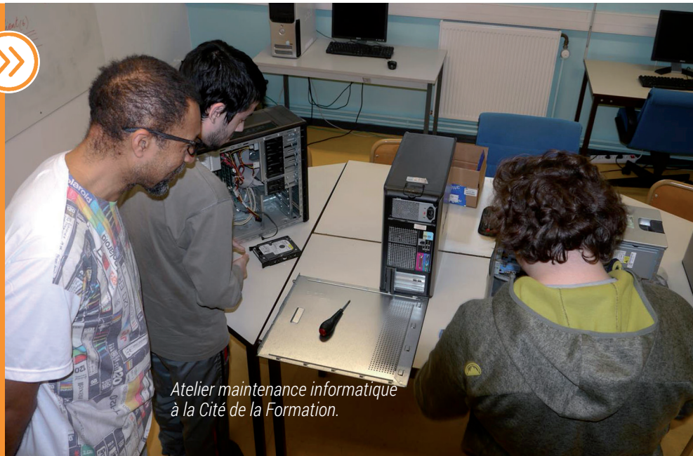
Atelier maintenance informatique à la Cité de la Formation.