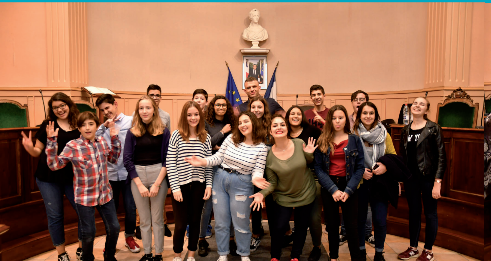
Les nouveaux membres du Conseil Jeunes