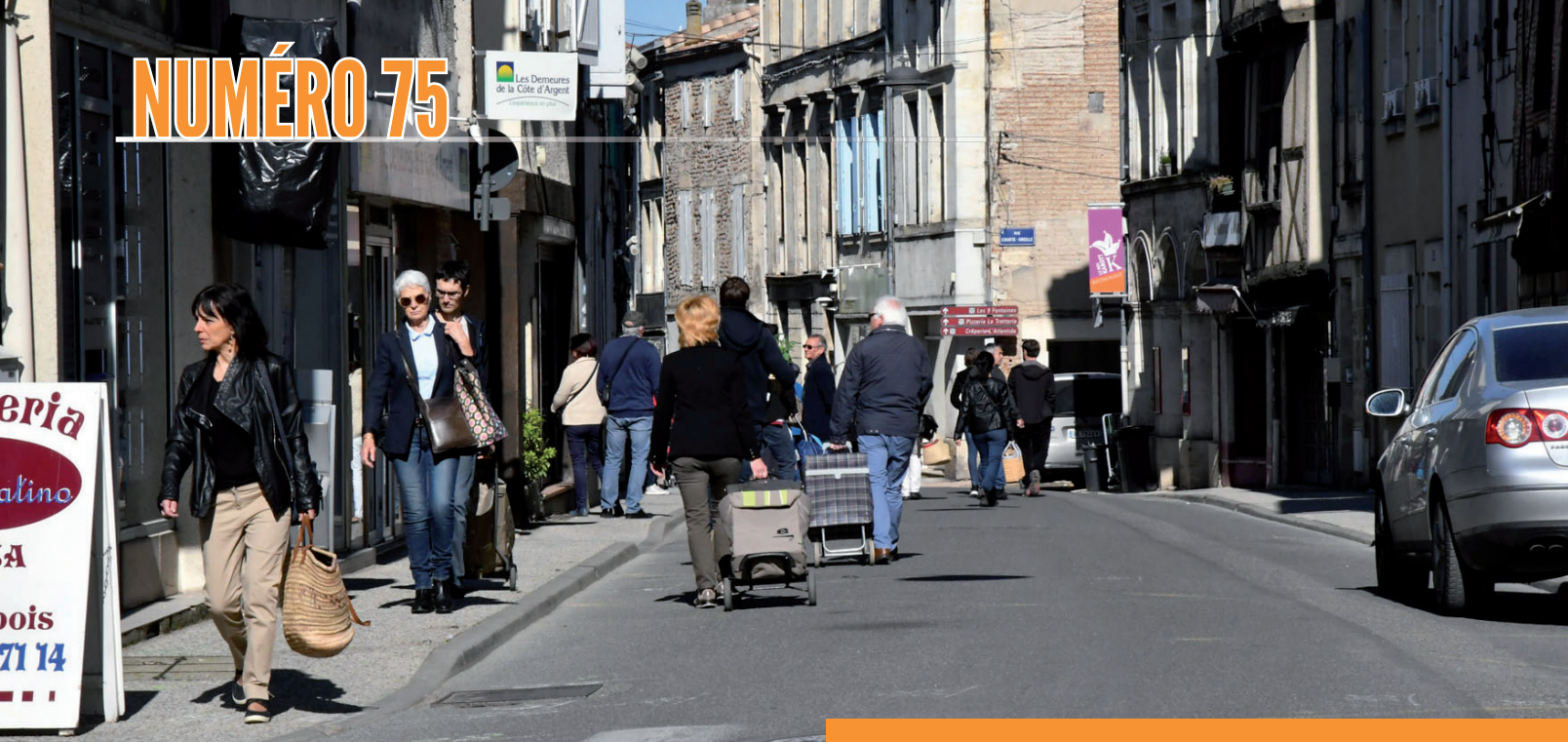
Les cabas des usagers du marché déambulent rue de la République.