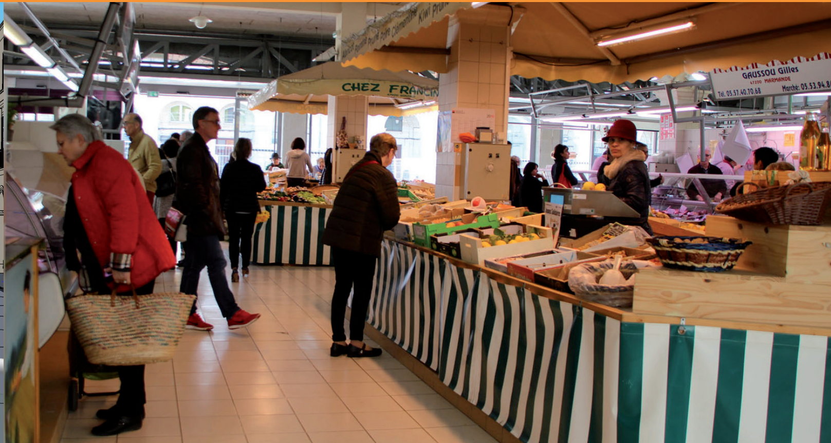
Un samedi matin sous la Halle.