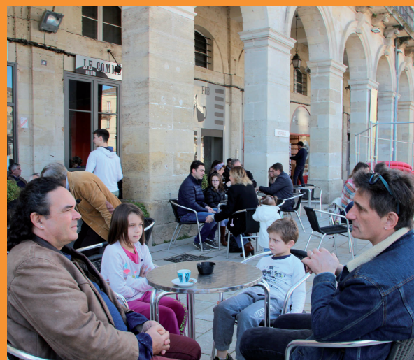
Les terrasses de la ville accueillent le printemps.

Faire vivre le cœur de la ville pour tous avec un projet global, c'est le pari de Centre Ville Cœur de Vie. Au delà des travaux actuels, qu'en est-il de ce projet urbain?