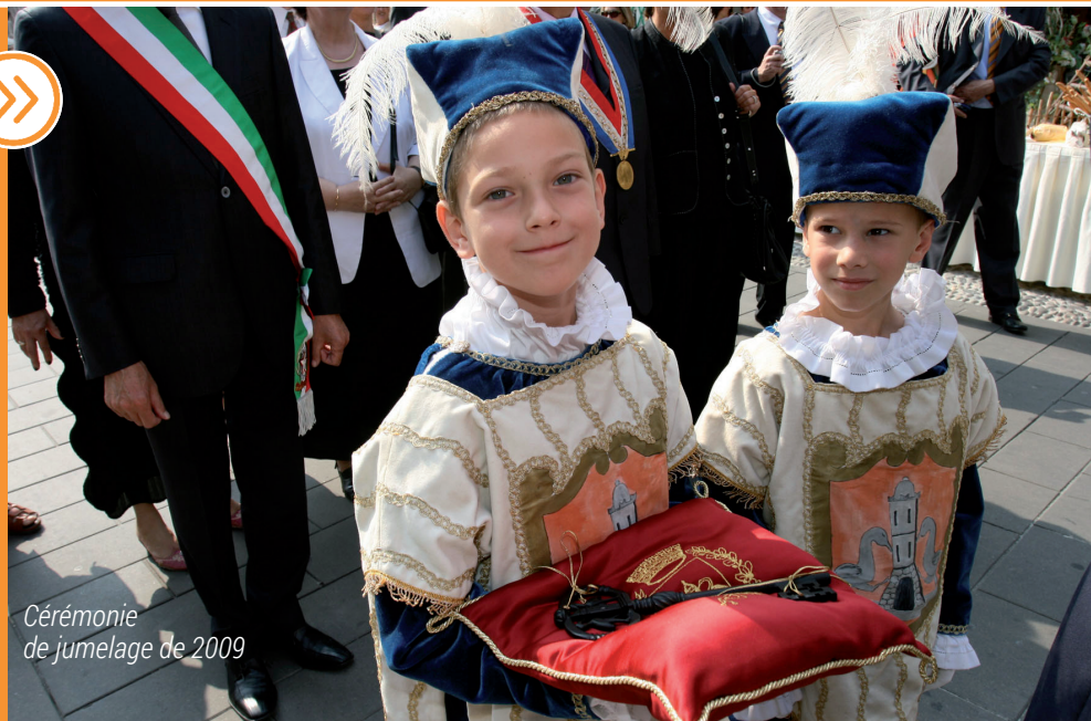
Cérémonie de jumelage de 2009