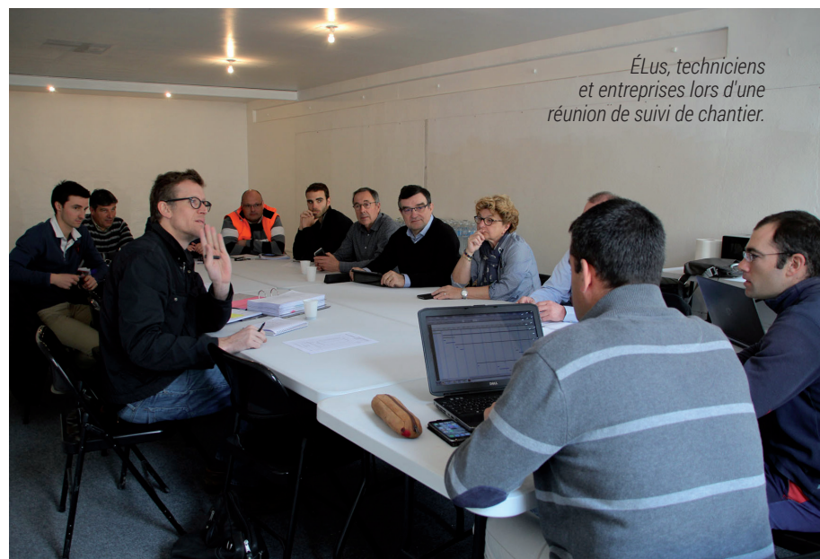
Élus, techniciens et entreprises lors d'une réunion de suivi de chantier.

Les centres anciens dit centres-villes ont connu dans les années 80-90 une mutation profonde liée au passage à l'ère urbaine. La dynamique commerciale se déplaçant en périphérie a entraîné une perte d'attractivité du centre. Que faire pour faire vivre le cœur de la ville ? Centre-Ville Cœur de Vie, un projet d'ensemble et une clé de la valorisation de Marmande.