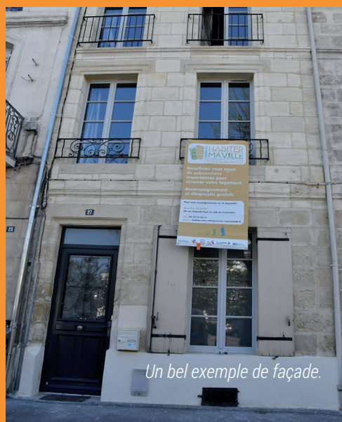
Un bel exemple de façade.