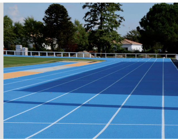
La piste d'athlétisme de Dartailh flambant neuve.

L'inauguration a lieu le samedi 15 octobre à 11h. Prêt, un, deux, trois... partez !