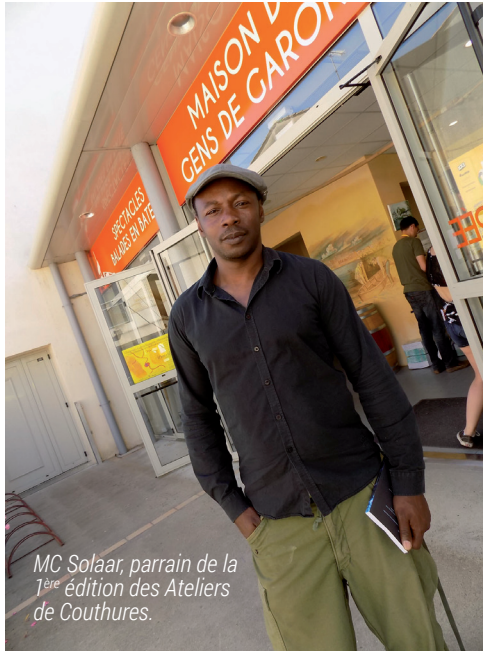
MC Solaar, parrain de la 1 ère édition des Ateliers de Couthures.

Du côté de Val de Garonne, des financements pour des projets et le pari réussi du Festival International du Journalisme Vivant.