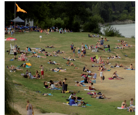
La plage, havre de paix du festival.

partagé par tous, Les Ateliers de Couthures, c'est ça ! Vivement juillet 2017. www.les-ateliers-de-couthures.fr