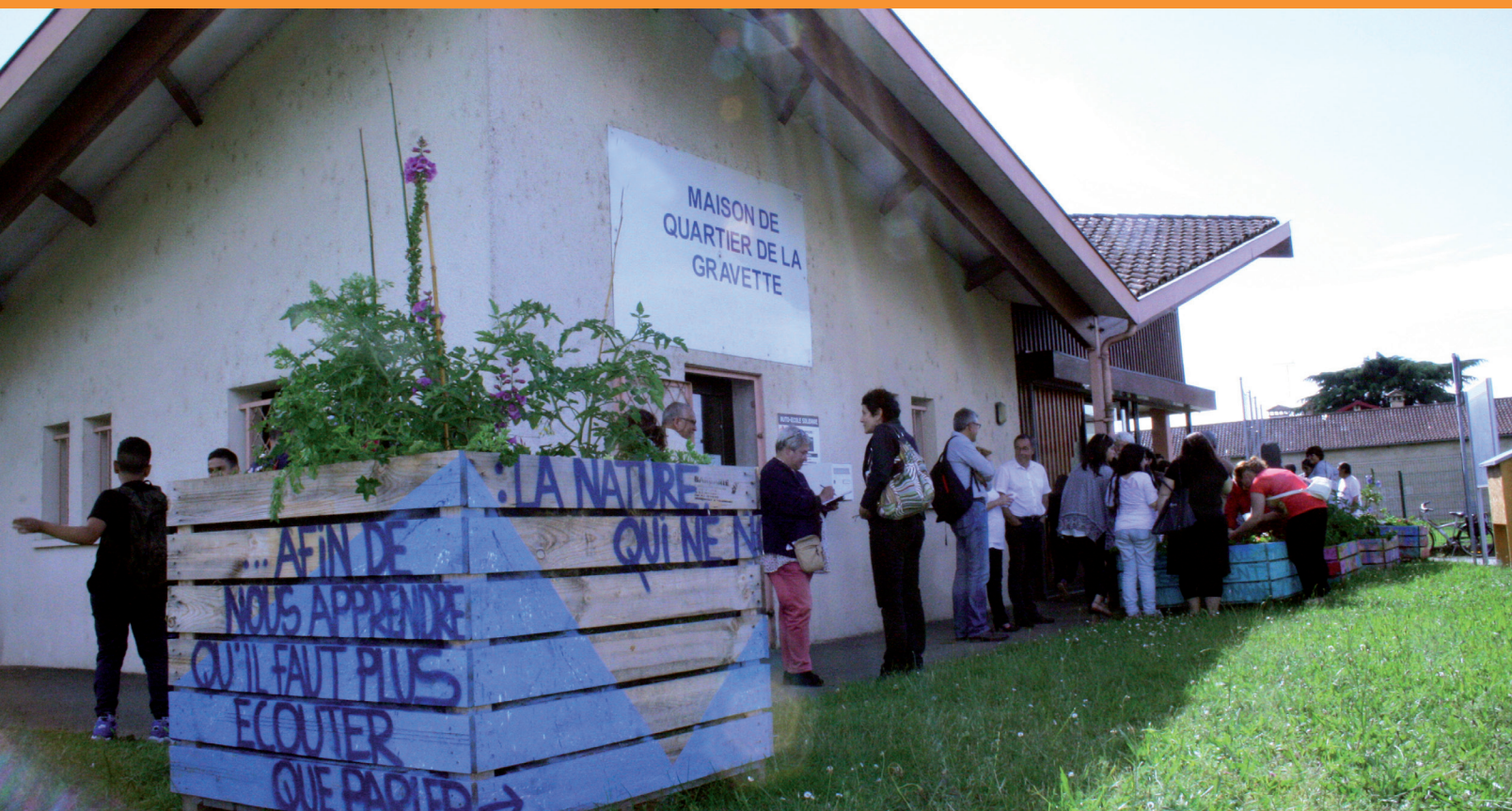
Le centre social s'installera à la maison de quartier et à la maison Mangin.