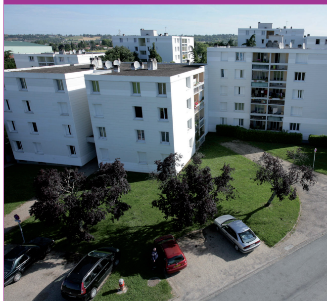
Les logements de la Résidence du Château d'Eau.