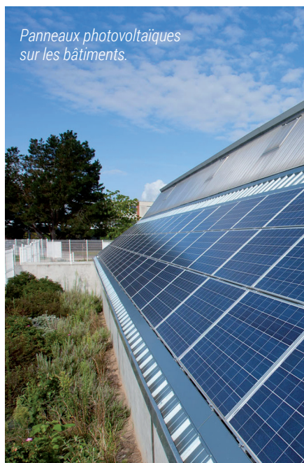
Panneaux photovoltaïques sur les bâtiments.

Signer une convention avec l'Agence de Développement et Innovation Nouvelle-Aquitaine, c'est avoir un accompagnement pour booster l'attractivité de notre territoire en soutenant nos entreprises dans leurs innovations, leurs filières émergentes. Cette signature consolide un partenariat déjà existant. Parmi les bénéficiaires, l'expertise apportée par l'ADI, a permis à l'entreprise Sacba de mettre en place un procédé de bois lamellé/croisé en s'équipant d'une table de découpe au plasma (cinq tables existent en France). Sacba est aujourd'hui la 3 e entreprise française de son secteur. VGA est la 1 ère intercommunalité à signer avec l'ADI.