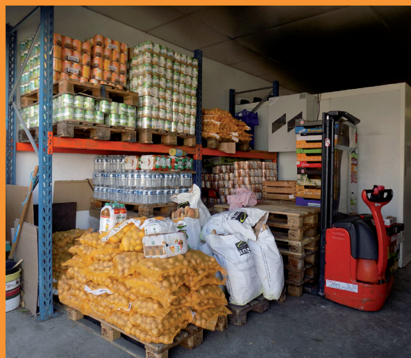
Dons alimentaires stockés dans l'entrepôt des Restos.

L'année 2017 est annoncée comme une année sociale. L'ouverture d'un centre social n'est qu'une partie de l'action menée à Marmande. Quelques éclairages et paroles d'acteurs locaux.