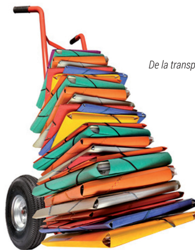
De la transparence des chiffres pour la liberté des commentaires.

Les chiffres ne sont que des chiffres, chacun est libre de ses commentaires.