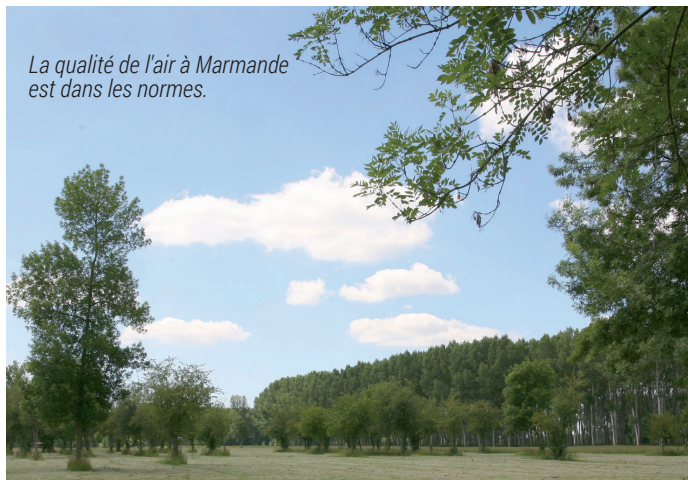
La qualité de l'air à Marmande est dans les normes.

Marmande ma ville revient dans chaque numéro sur des informations sous forme de clin d'œil ou d'éclairage plus précis.