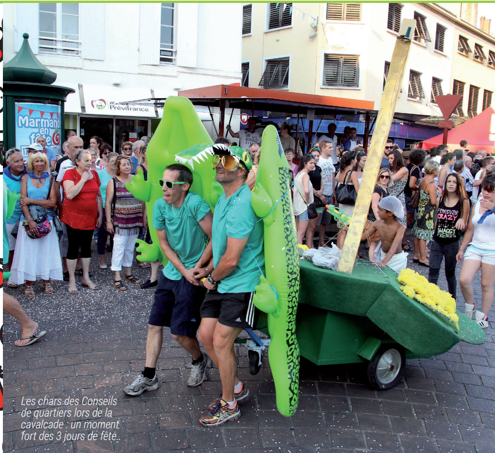
Les chars des Conseils de quartiers lors de la cavalcade : un moment fort des 3 jours de fête.