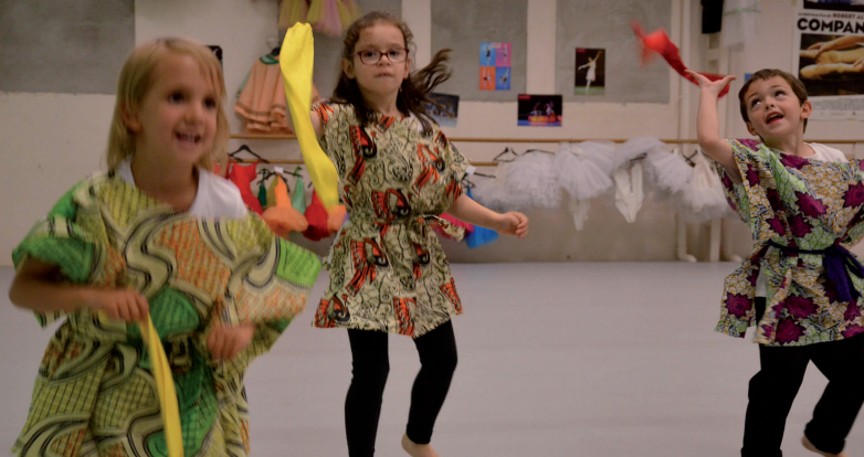
Les jeunes pousses du Jardin des Artistes.