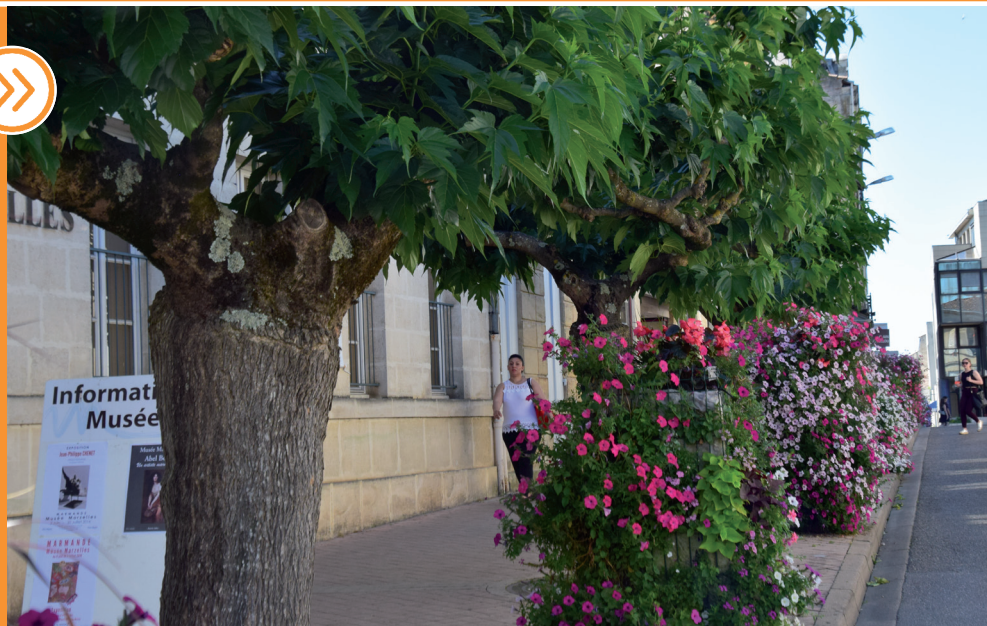
Ici et là, les rues de Marmande fleurissent, verdissent et végétalisent la ville.

à noter en Septembre : Journée Vélo Sensibilisation autour de la pratique du vélo en zone de rencontre.