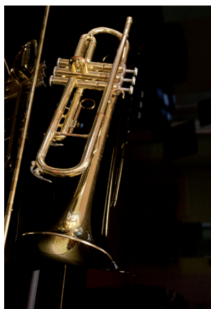
Une école qui a du souffle

les Marmandais et jusqu'à 433 € pour les hors commune). Dès 4 ans, les enfants sont regroupés au sein du "Jardin des artistes" pour développer leur expression corporelle et sonore.