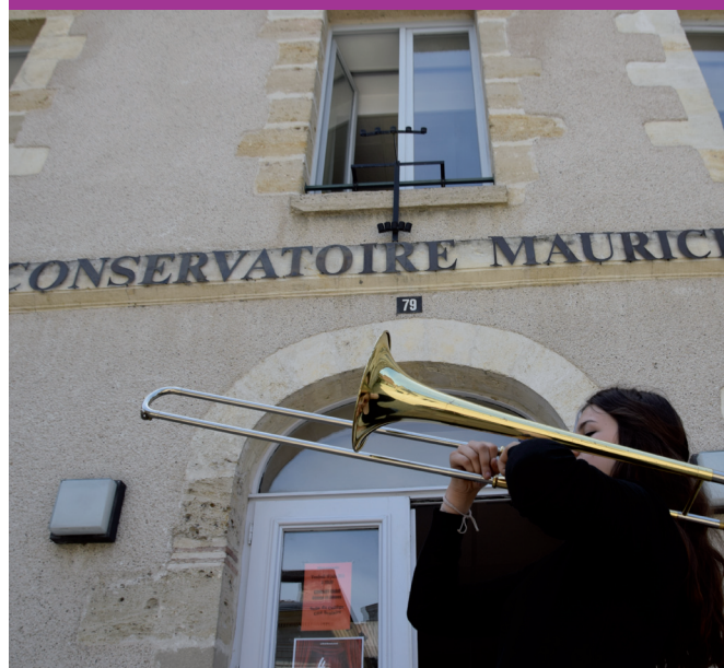
...du Conservatoire de Musique et de Danse.

Le conservatoire est aussi un lieu de vie culturelle et comme dans toute cour d'école, ça rit, ça chante, ça danse et ça joue... encore plus à Ravel.