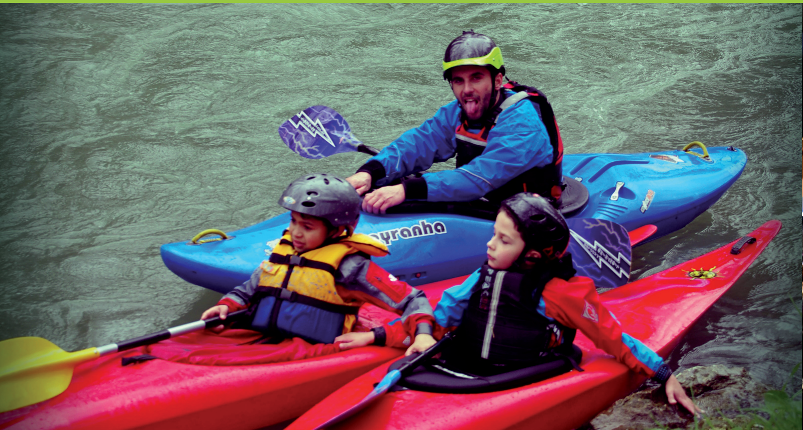
Séance d'initiation au kayak : même pas peur !