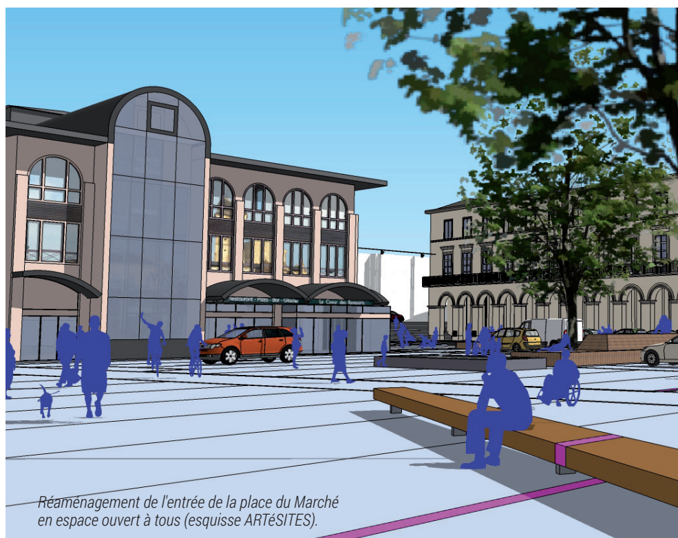
Réaménagement de l'entrée de la place du Marché en espace ouvert à tous (esquisse ARTÉSITES).

Le premier acte de Centre-Ville Cœur de Vie concernait la mobilité avec un nouveau schéma de circulation et de stationnement. Aujourd'hui, débute la phase active pour le secteur n°1, le cœur médiéval. Deux opérations sur le quartier République/Marché et la zone Remparts/Filhole s'engageront début 2017 avec deux maîtres d'œuvres (ARTÉSITES et P.U.V.A.). L'objectif est de créer un itinéraire privilégié entre les parkings de Birac et de la Filhole. Les travaux de voiries (rue de la République) et de l'espace public (place du Marché) doivent permettre l'émergence d'un centre d'animation du quartier. Un escalier reliant les places du Marché et Maury, facilitera les accès de l'une à l'autre et le mobilier urbain plus accueillant, invitera l'usager à s'approprier l'espace. Les esquisses nous en donne un aperçu.