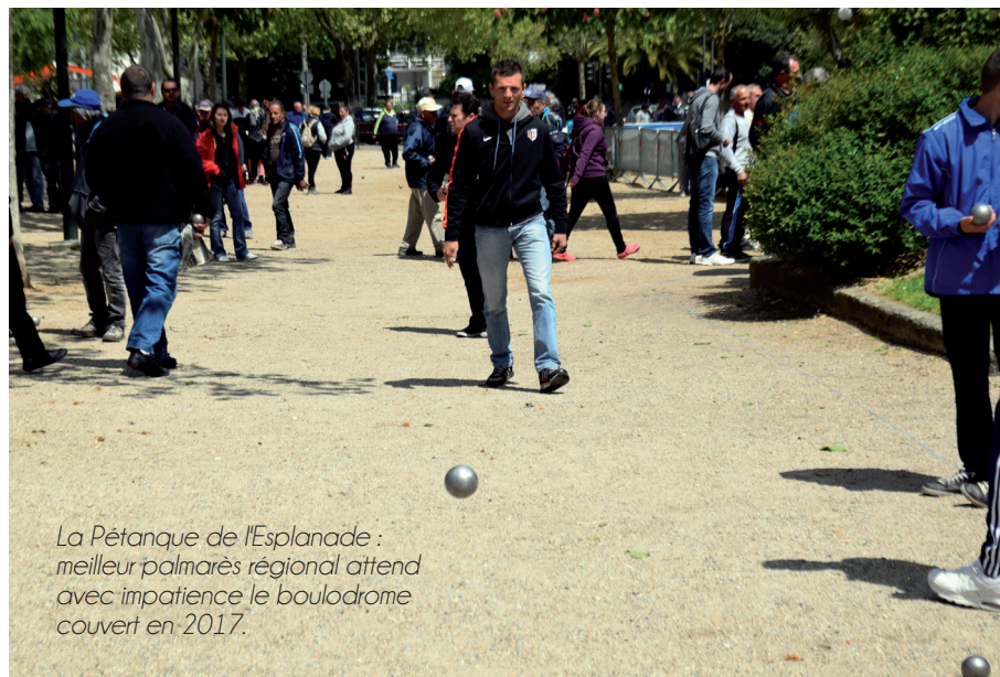
La Pétanque de l'Esplanade : meilleur palmarès régional attend avec impatience le boulo-drome couvert en 2017.

Ces trente dernières années, les pratiques sportives et culturelles se sont fortement développées, le résultat d'une démocratisation de l'accès et de l'offre. Aujourd'hui, une corrélation positive existe entre dynamisme socioéconomique d'une ville, d'un territoire et implantation d'événements culturels et sportifs, et inversement. C'est le cas chez nous.