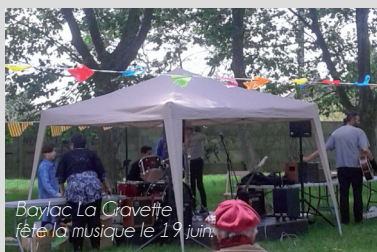
Baylac La Gravette fête la musique le 19 juin

C'est une nouvelle synergie à trouver pour les habitants. Il va de la barrière de Miramont jusqu'à l'Eaubonne, avec l'impasse du Moulin. Il comprend le centre des impôts, l'école Labrunie, la résidence des Glycines, Saint-Vincent de Paul, une Halte-Garderie, une coiffeuse et une épicerie.