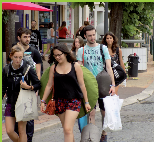
Garorock : Marmande accueille les premiers festivaliers.

Le point sur ces secteurs qui font bouger Marmande.