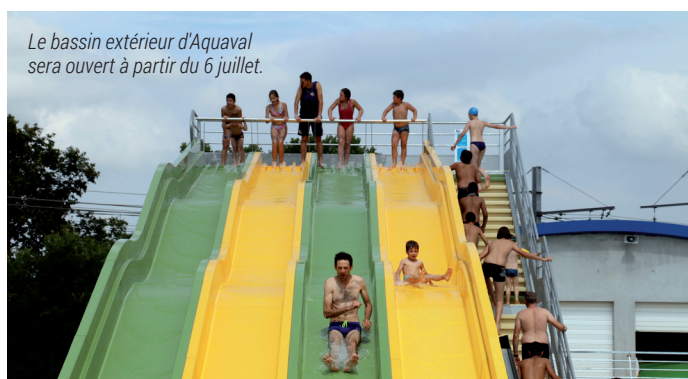
Le bassin extérieur d'Aquaval sera ouvert à partir du 6 juillet.