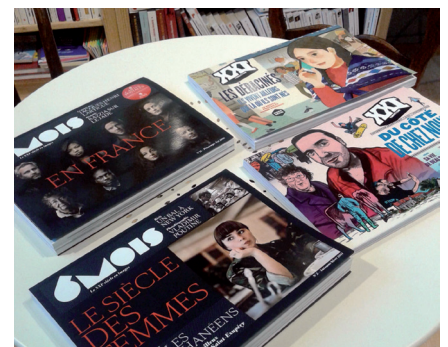
"6Mois" et "XXI", des revues à découvrir.

Du 29 au 31 juillet, un moment à nul autre pareil dans notre territoire, alors venez et réservez sur : www.les-ateliers-de-couthures.fr