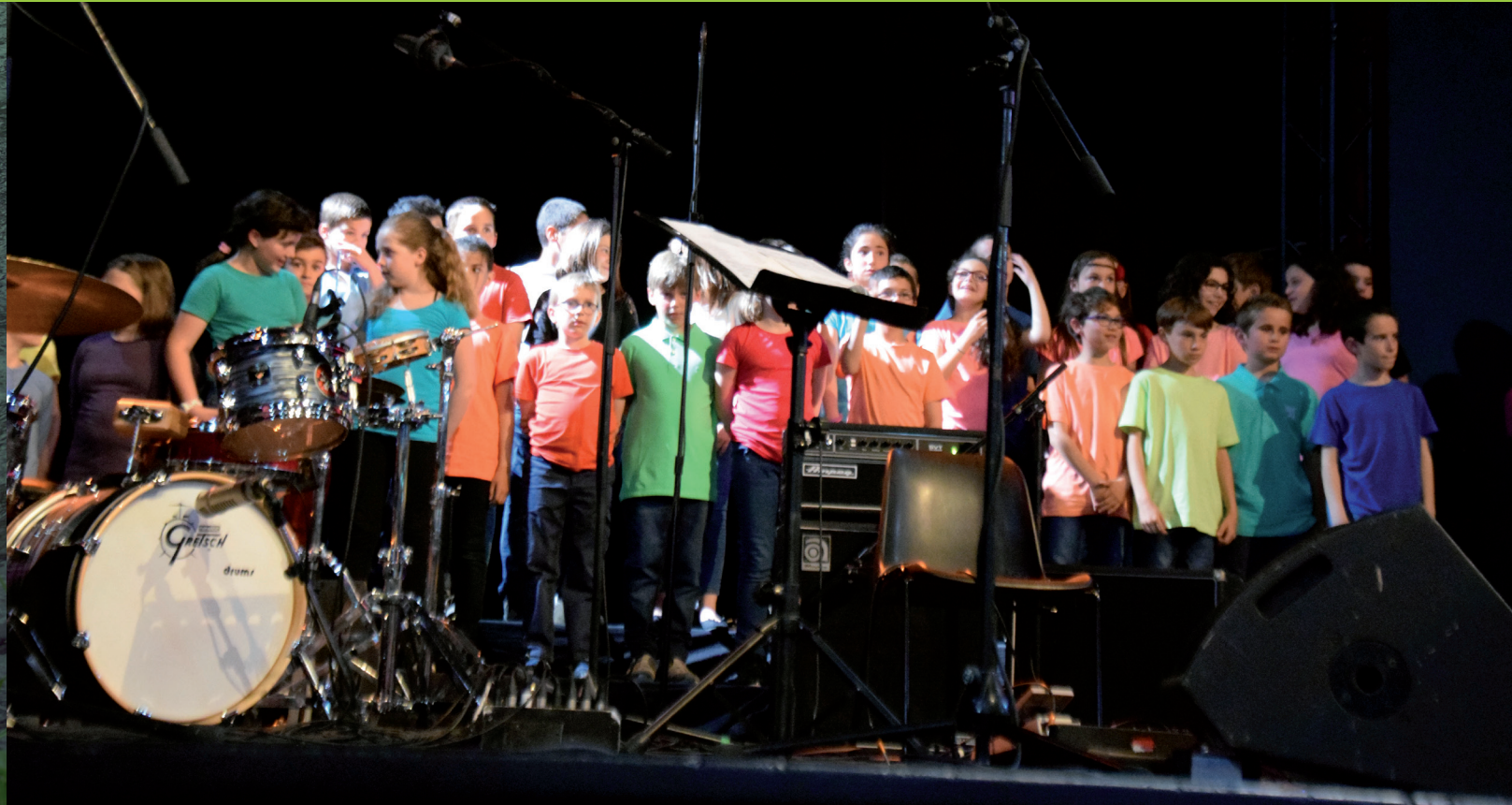
Les enfants sur la scène du Comœdia le 20 mai dernier.