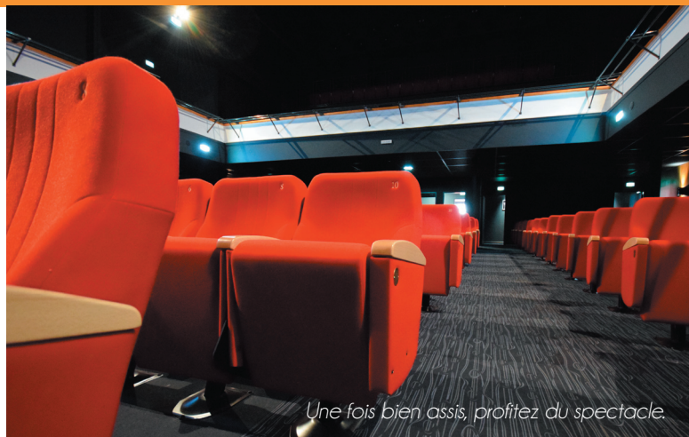
Une fois bien assis, profitez du spectacle.