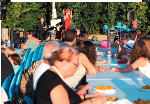
Dimanche, ambiance et auberge espagnole à la Filhole.