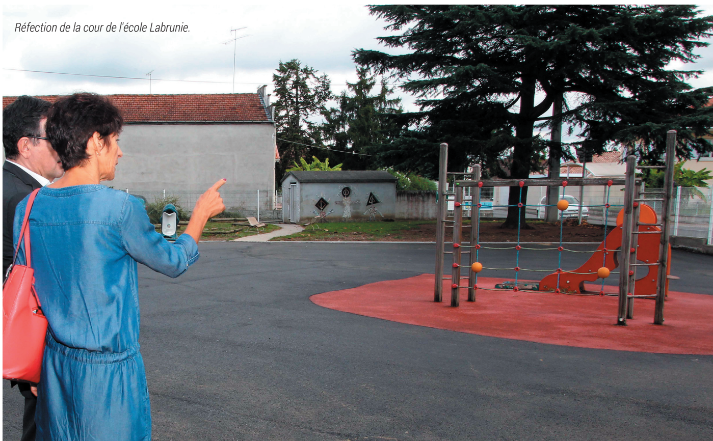
Réfection de la cour de l'école Labrunie.

Septembre, c'est la rentrée pour tous mais surtout pour nos écoliers et leurs professeurs. Les élus profitent de chaque rentrée pour faire le tour des écoles et aller à la rencontre des enseignants, du personnel, des familles et bien sûr des enfants mais aussi pour observer les travaux réalisés par les services municipaux au cours de l'été.