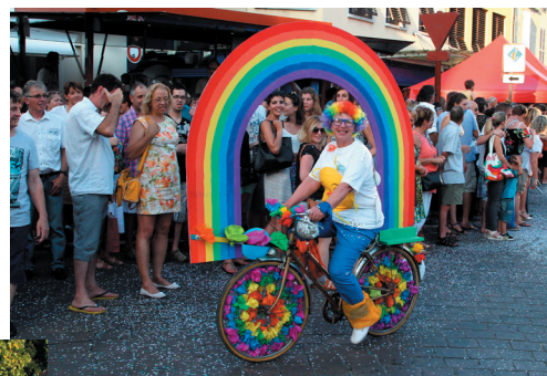
Samedi, le conseil de quartier Trec arrive en vélo arc en ciel.