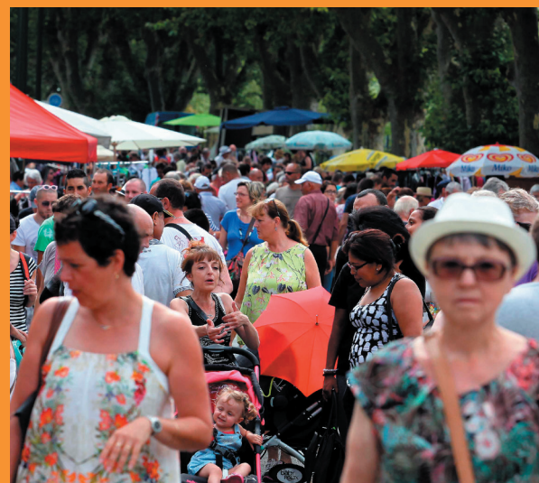
Les dernières emplettes avant la rentrée

Il se passe toujours des choses dans une ville. Qu'en est-il chez nous, du côté sportif, culturel, de la jeunesse ? Infos et points de vues.