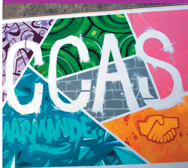
Graff réalisé par Ména et Hybe des "Updaters"

De quoi s'assurer moins cher et préserver sa santé !