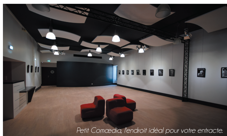
Petit Comœdia, l'endroit idéal pour votre entracte.