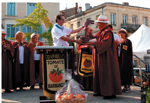
Vendredi, lancement des festivités et remise des clés de la Ville à la Confrérie de la Pomme d'Amour.