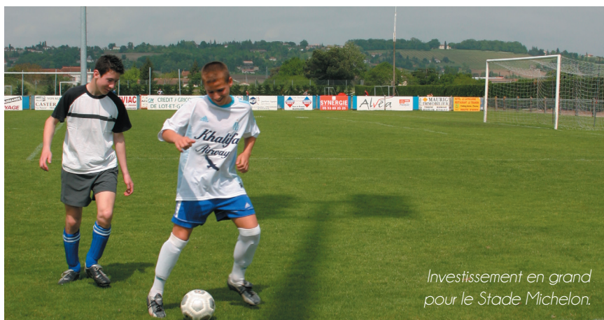
Investissement en grand pour le Stade Michelon.

La manifestation "Filhole en Fête" a dû être annulée cette année en raison des intempéries. On peut comprendre la déception des uns et des autres. En effet, ce jour est un rendez-vous intergénérationnel et la vitrine de la vie associative locale. Ce dynamisme se retrouve notamment dans le secteur sportif. Marmande est une ville sportive, ce n'est pas seulement un slogan mais une réalité. Le point sur les derniers investissements et soutiens aux associations.