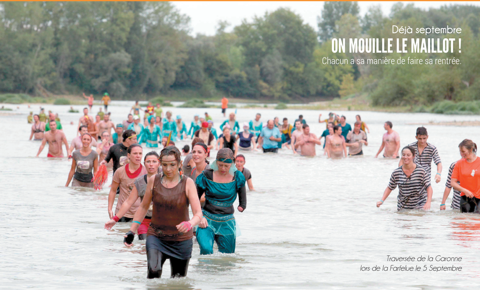
Traversée de la Garonne lors de la Farfelue le 5 Septembre

Chacun a sa manière de faire sa rentrée.