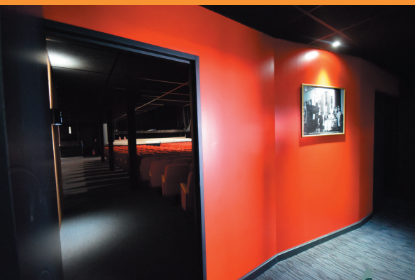
Par ici, entrez dans le "nouveau" Comœdia.