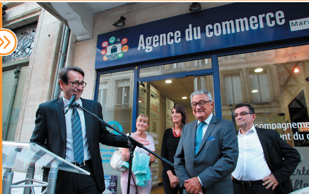
Le commerce marmandais a enfin sa vitrine.