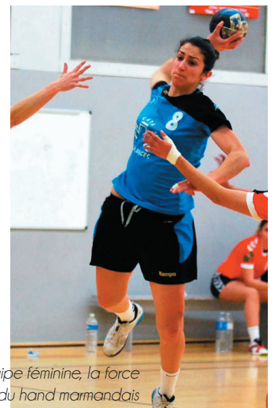
L'équipe féminine, la force de frappe du hand marmandais

Vous voulez faire du sport, vous êtes dans la bonne ville !