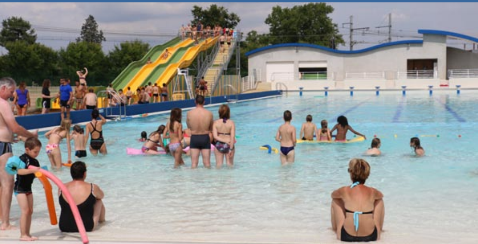
Le bassin extérieur d'Aquaval, piscine à vagues et pentaglisse.