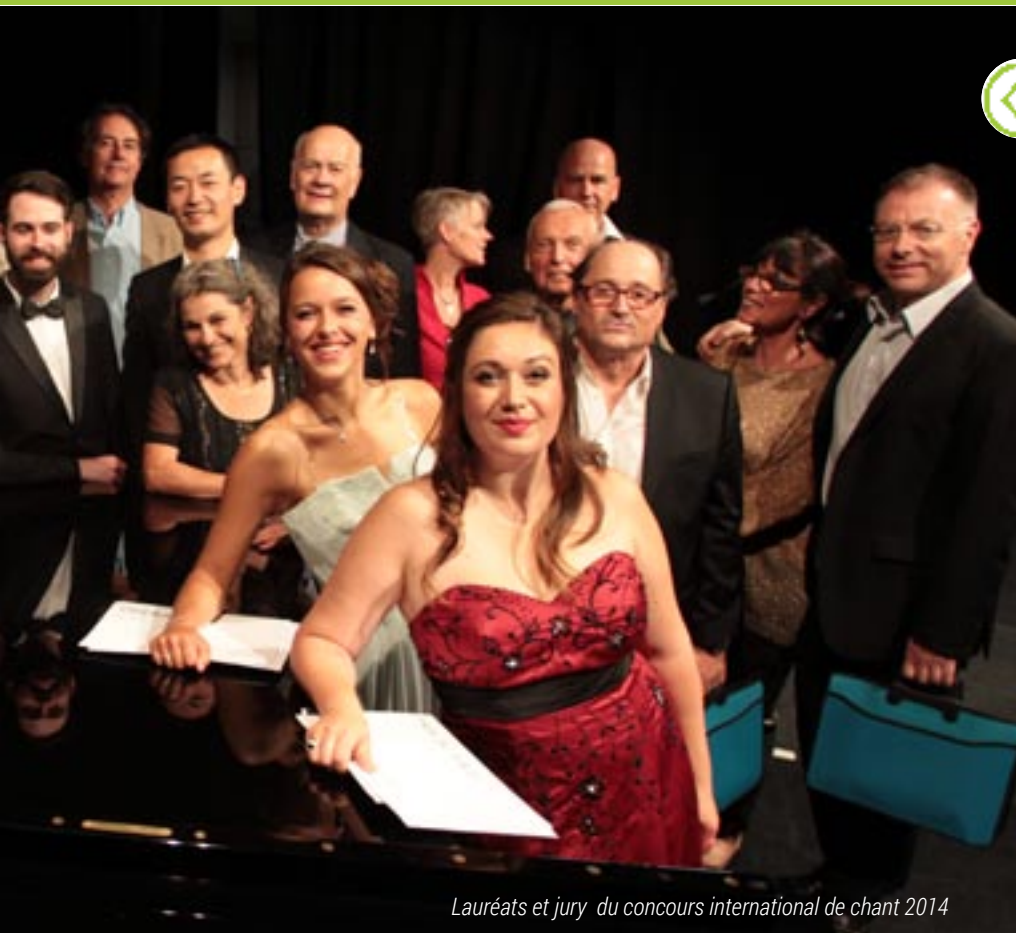
Lauréats et jury du concours international de chant 2014