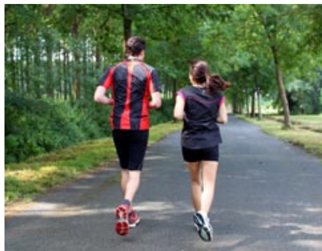
Couple de joggers à la Filhole

Longtemps, on l'a ignorée alors maintenant qu'on la regarde, forcément, La Filhole sort ses atouts. Pour notre plaisir à tous. Et, elle n'a pas dit son dernier mot.