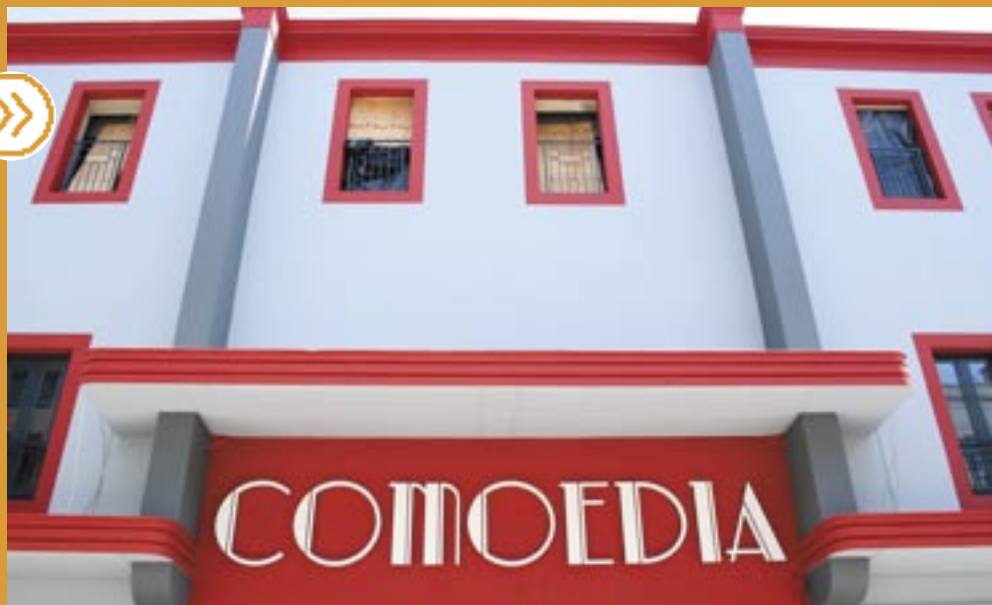
Le Comoedia et son style art-déco vous est désormais ouvert.