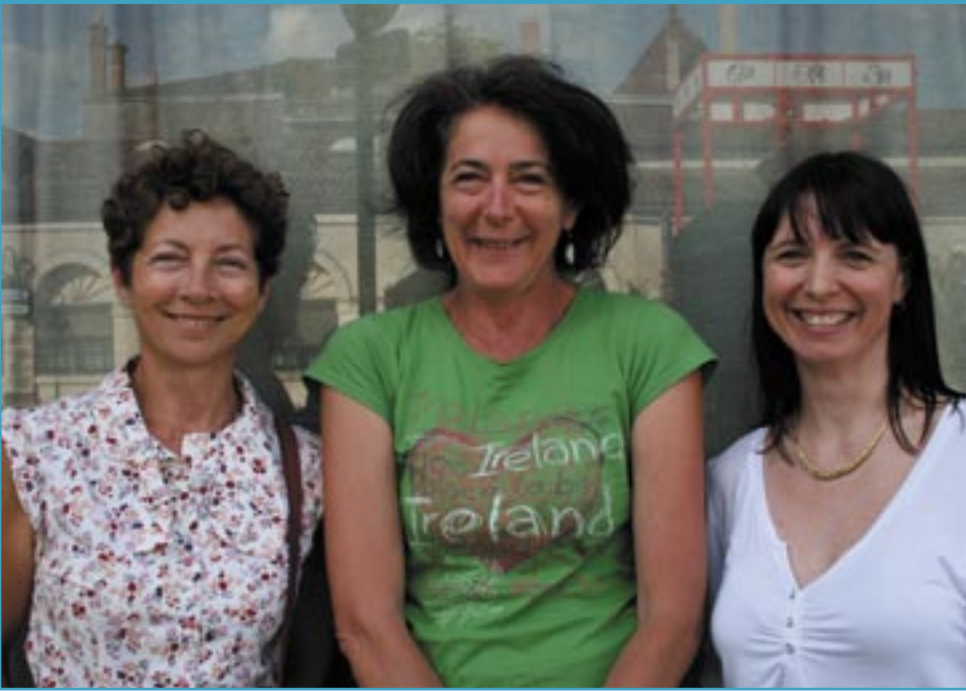
Les représentantes du conseil de quartier Beyssac