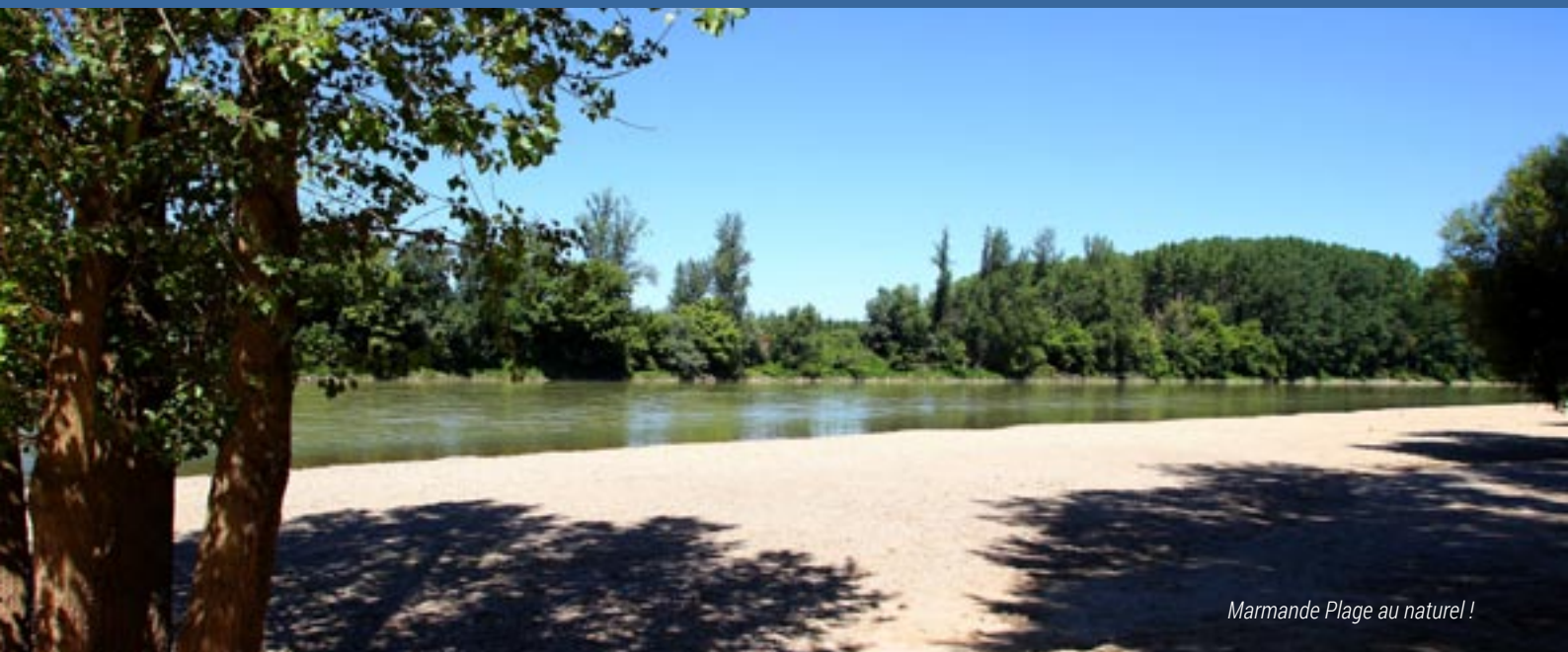
Marmande Plage au naturel !