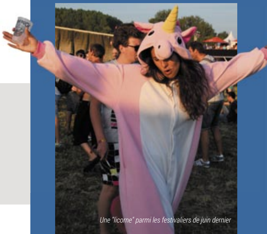
Une "licorne" parmi les festivaliers de juin dernier