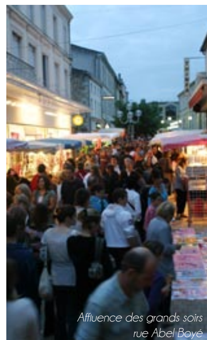
Affluence des grands soirs rue Abel Boyé

L'incontournable plaine de La Filhole, écrin de verdure et de culture cet été avec un land' art, est l'endroit idéal pour un été animé et au frais.