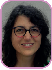
Séverine Chastaing déléguée à la transition écologique et au développement durable