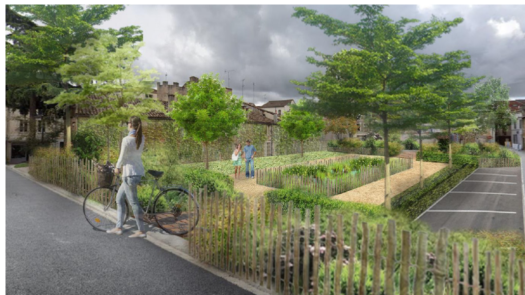
Vue depuis la rue LOZES (réalisation CDC BIODIVERSITE)

Votre nouvel espace de fraîcheur en centre-ville