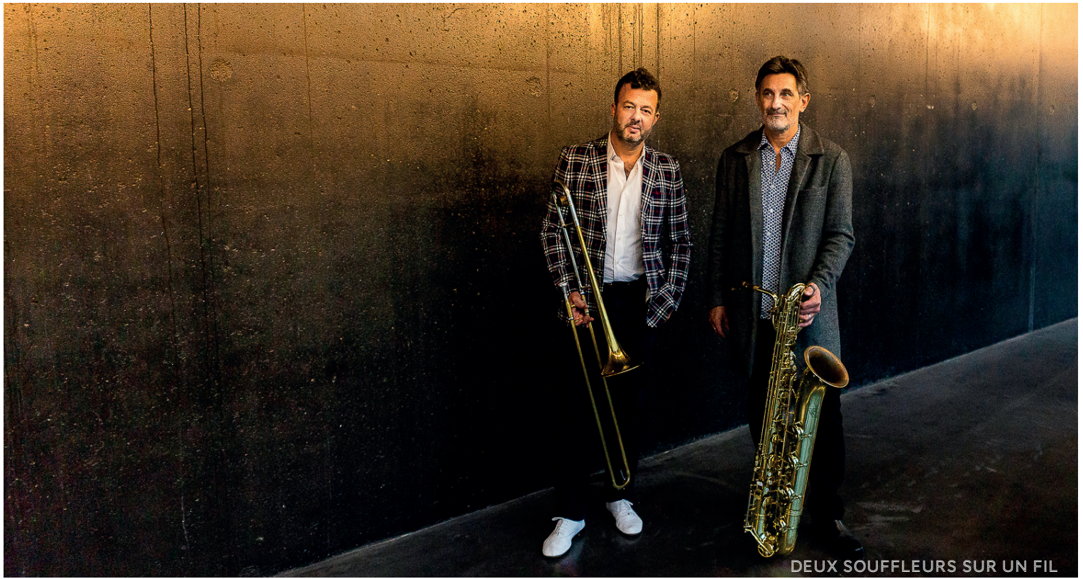
DEUX SOUFFLEURS SUR UN FIL