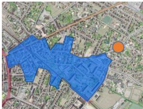
Localisation du centre commercial LA GRAVETTE